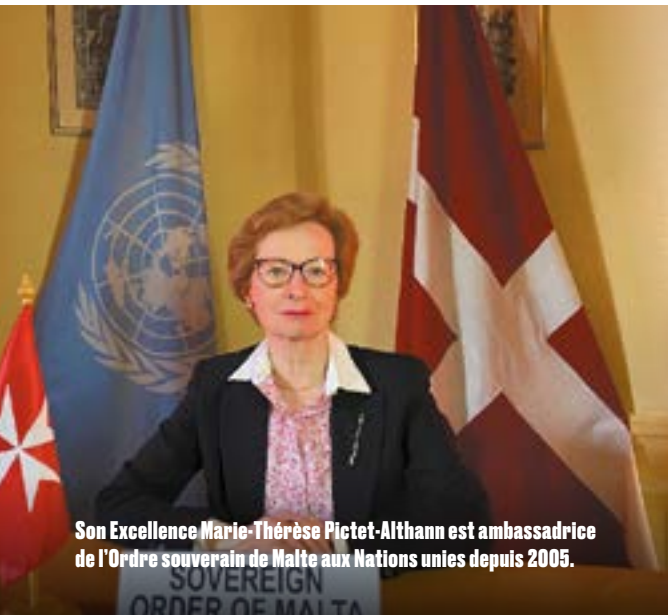
Son Excellence Marie-Thérèse Pictet-Althann est ambassadrice de l'Ordre souverain de Malte aux Nations unies depuis 2005.