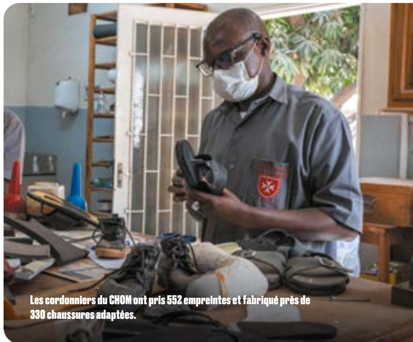
Les cordonniers du CHOM ont pris 552 empreintes et fabriqué près de 330 chaussures adaptées.