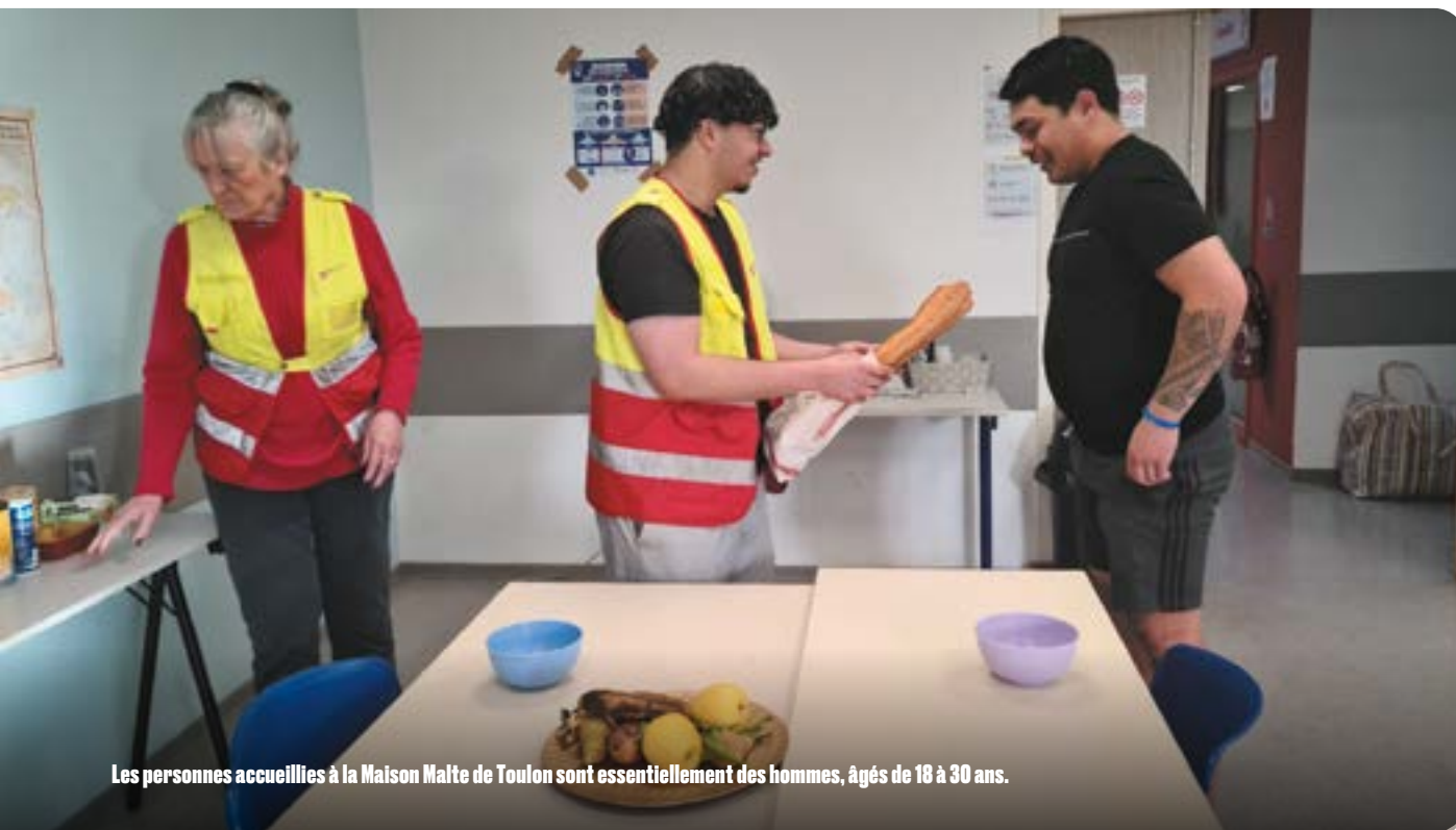
Les personnes accueillies à la Maison Malte de Toulon sont essentiellement des hommes, âgés de 18 à 30 ans.

occupées. « Pas le temps de m'ennuyer, confie-t-il. Je fais tout ce que les bénévoles ne peuvent pas faire. Je discute beaucoup avec les jeunes accueillis. Nous avons le même âge, les rapports sont faciles ! Ils ont toujours quelque chose à raconter, une anecdote. Je les aide comme je peux ».