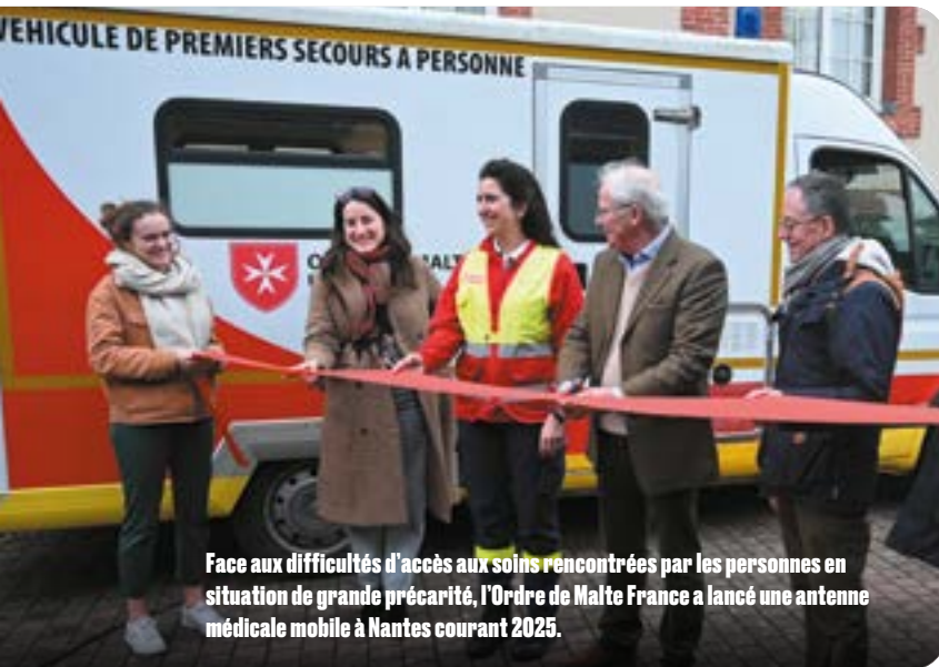
Face aux difficultés d'accès aux soins rencontrées par les personnes en situation de grande précarité, l'Ordre de Malte France a lancé une antenne médicale mobile à Nantes courant 2025.