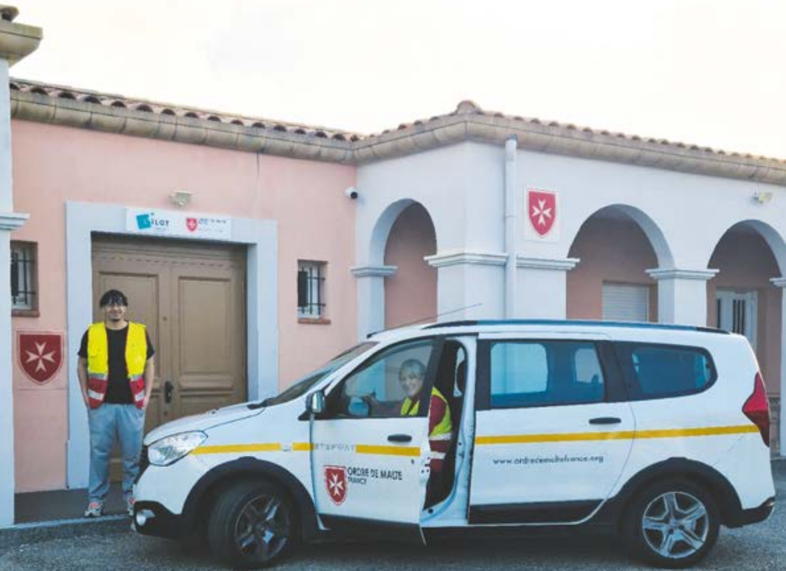
Inaugurée le 24 octobre 2025, la Maison Malte de Toulon compte déjà des habitués parmi ses bénéficiaires.