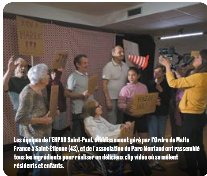
Les équipes de l'EHPAD Saint-Paul, établissement géré par l'Ordre de Malte France à Saint-Étienne (42), et de l'association du Parc Montaud ont rassemblé tous les ingrédients pour réaliser un délicieux clip vidéo où se mêlent résidents et enfants.

Baisse du stress, meilleur sommeil, maintien des fonctions cérébrales, joie de vivre, rupture de l'isolement, sentiment d'utilité, dynamisation du lieu de vie... : les bénéfices du maintien d'un lien social fort pour les personnes âgées sont nombreux. À l'EHPAD Saint-Paul, les bénévoles de l'Ordre de Malte France y contribuent. Au même titre que les activités avec des personnes extérieures, messes, prières et visites régulières sont essentielles pour les résidents.