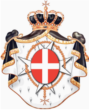
Ordre Souverain de Malte

Relations diplomatiques avec les pays et les organisations internationales, dont :