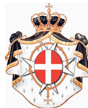
Ordre Souverain de Malte

L'Ordre souverain de Malte entretient des relations diplomatiques avec plus de 130 pays. Il dispose même d'un siège d'observateur permanent auprès des Nations unies, de la Commission européenne et d'autres organisations internationales.