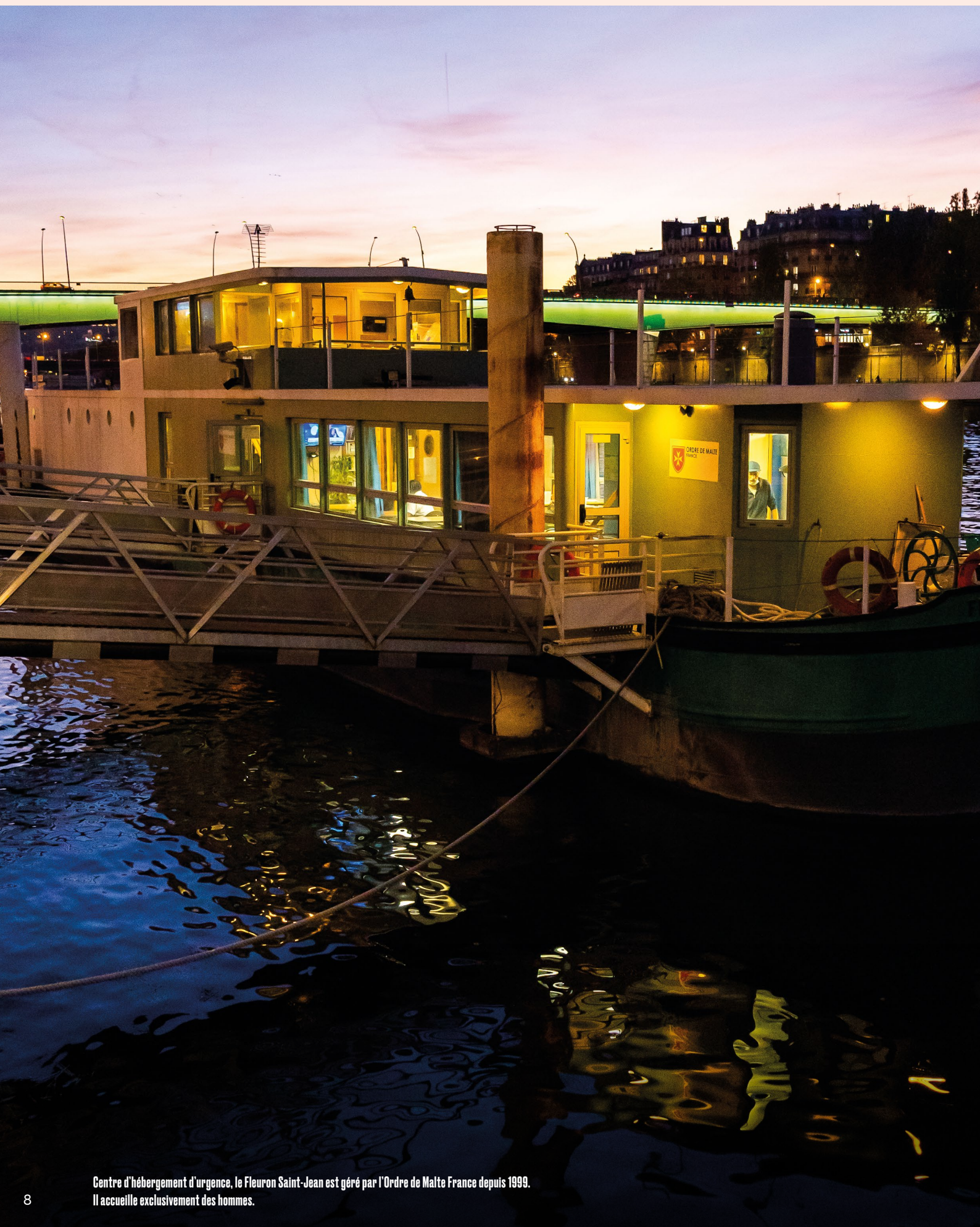
Centre d'hébergement d'urgence, le Fleuron Saint-Jean est géré par l'Ordre de Malte France depuis 1999. Il accueille exclusivement des hommes.