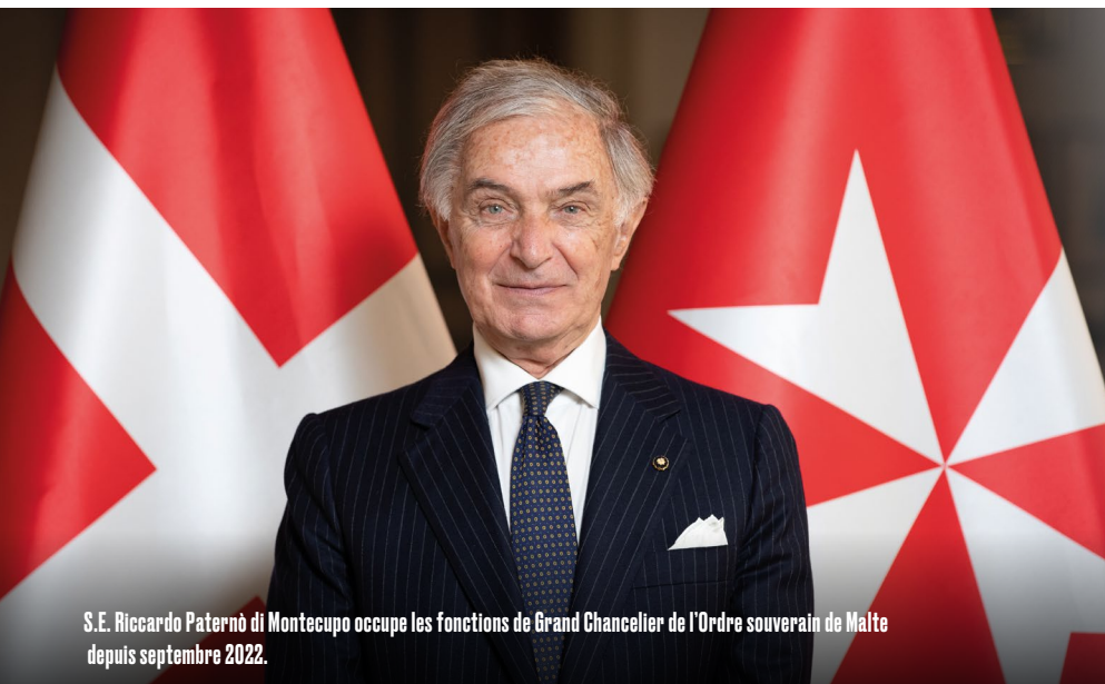
S.E. Riccardo Paternò di Montecupo occupe les fonctions de Grand Chancelier de l'Ordre souverain de Malte depuis septembre 2022.