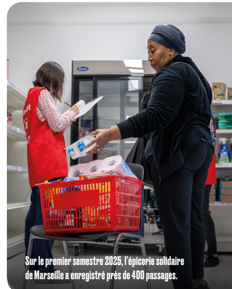
Sur le premier semestre 2025, l'épicerie solidaire de Marseille a enregistré près de 400 passages.

Du 1 er janvier au 15 juillet 2025, l'épicerie a enregistré 391 passages. Un développement rendu possible « par le dévouement et l'implication généreuse des bénévoles, les partenariats avec d'autres organismes comme la banque alimentaire », souligne l'ancien délégué. À présent, la délégation locale a pour objectif d'étoffer son équipe pour pouvoir répondre aux demandes, de plus en plus nombreuses, tout en assurant un accueil de qualité et des approvisionnements réguliers. Par ailleurs, d'autres voies de ressources alimentaires sont actuellement à l'étude. ●