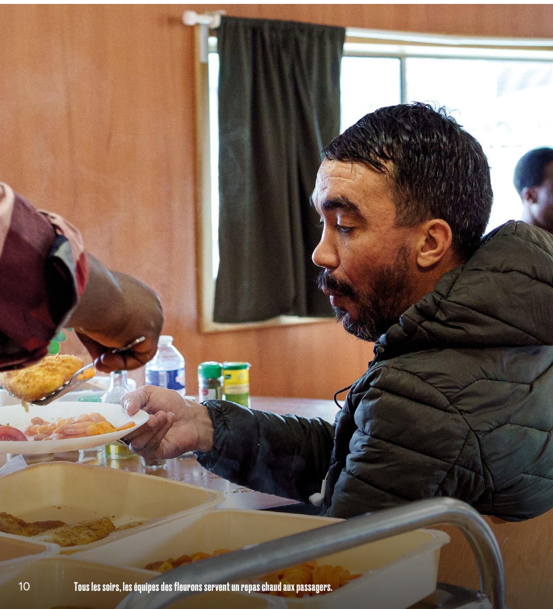
Tous les soirs, les équipes des fleurons servent un repas chaud aux passagers.

Tous les jours, quatre des dix salariés de l'équipe sont présents pour accompagner les passagers dans leurs démarches administratives, préparer leurs entretiens d'embauche, les mettre en relation avec