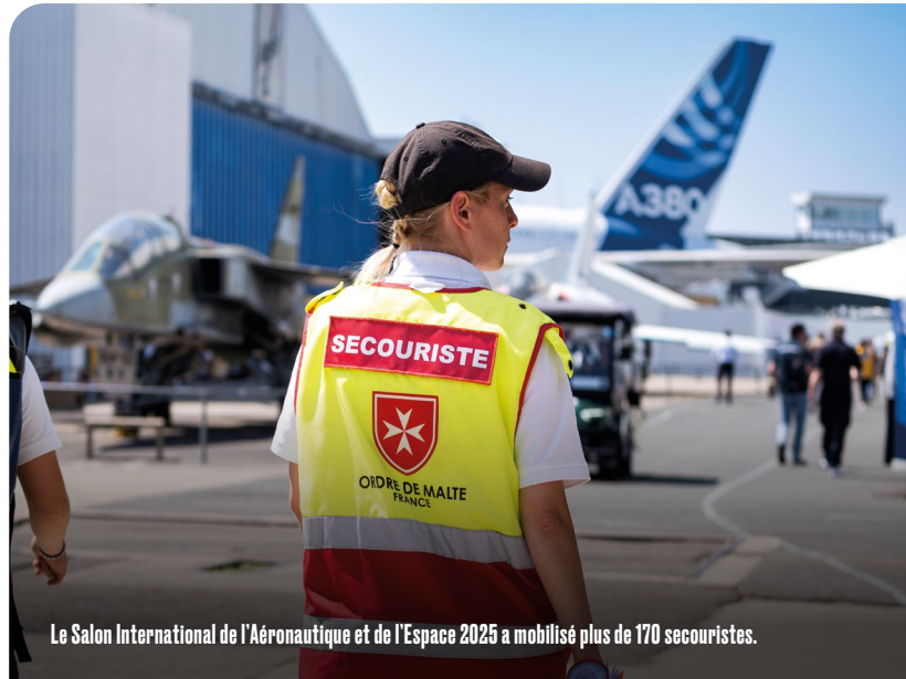
Le Salon International de l'Aéronautique et de l'Espace 2025 a mobilisé plus de 170 secouristes.

« Ce qui nous a marqués cette année, c'est la grosse vague de chaleur qui s'est abattue le samedi. Nous avons assuré 150 prises en charge sur seulement 4 ou 5h. (...) Notre travail a été salué par les organisateurs du Salon (selon eux, l'Ordre de Malte a