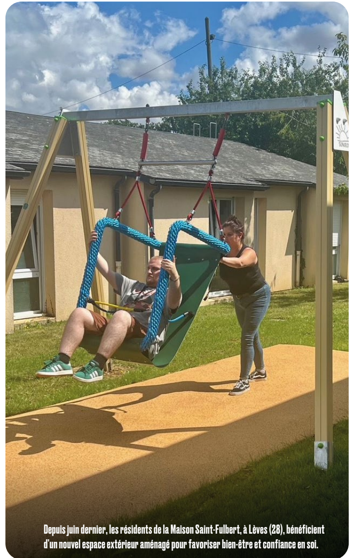
Depuis juin dernier, les résidents de la Maison Saint-Fulbert, à Lèves (28), bénéficient d'un nouvel espace extérieur aménagé pour favoriser bien-être et confiance en soi.