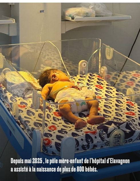
Depuis mai 2025, le pôle mère-enfant de l'hôpital d'Elavagnon a assisté à la naissance de plus de 800 bébés.