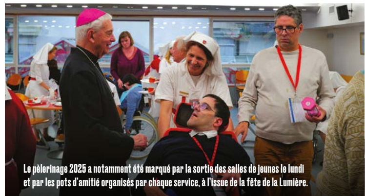
Le pèlerinage 2025 a notamment été marqué par la sortie des salles de jeunes le lundi et par les pots d'amitié organisés par chaque service, à l'issue de la fête de la Lumière.