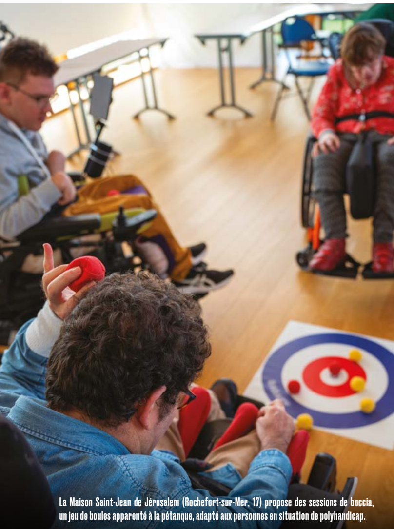
La Maison Saint-Jean de Jérusalem (Rochefort-sur-Mer, 17) propose des sessions de boccia, un jeu de boules apparenté à la pétanque, adapté aux personnes en situation de polyhandicap.