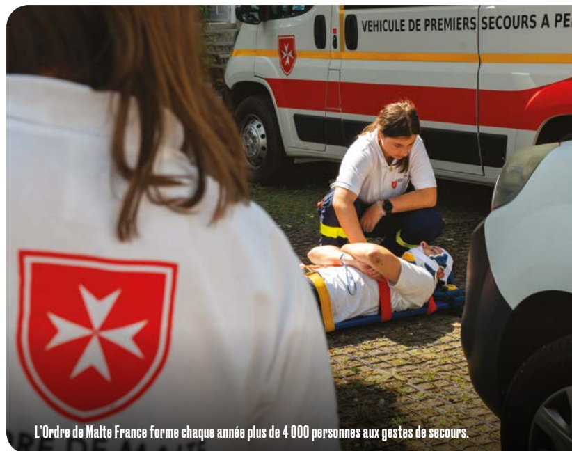
L'Ordre de Malte France forme chaque année plus de 4 000 personnes aux gestes de secours.

Les PSE 1 et PSE 2 1 sont les formations de base, permettant à leurs détenteurs d'appliquer les gestes de secours lors de situations d'urgence. Ces formations permettent à nos bénévoles d'intervenir au sein d'une équipe de secours, mais le PSC 2 suffit pour le grand public. Guillaume Poncelet, responsable du Pôle For-