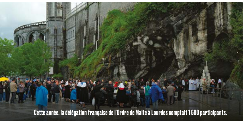
Cette année, la délégation française de l'Ordre de Malte à Lourdes comptait 1 600 participants.