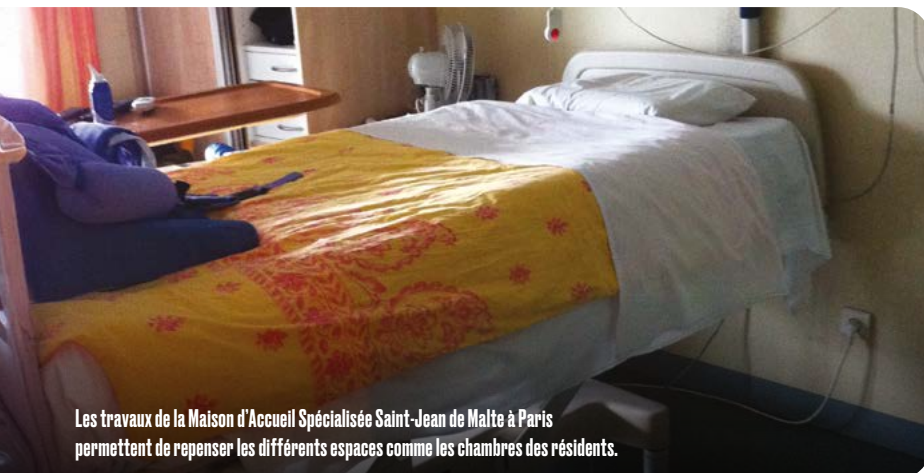
Les travaux de la Maison d'Accueil Spécialisée Saint-Jean de Malte à Paris permettent de repenser les différents espaces comme les chambres des résidents.