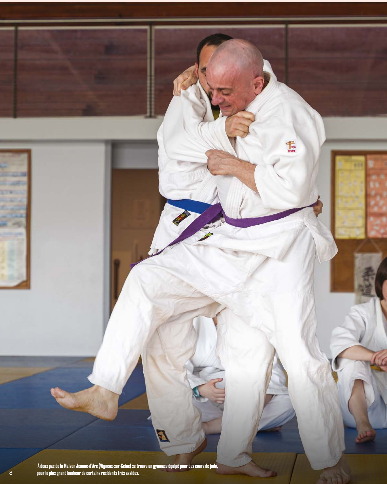
À deux pas de la Maison Jeanne-d'Arc (Vigneux-sur-Seine) se trouve un gymnase équipé pour des cours de judo, pour le plus grand bonheur de certains résidents très assidus.