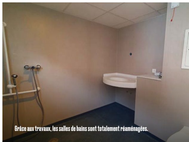
Grâce aux travaux, les salles de bains sont totalement réaménagées.

Majoritairement financé par l'Agence Régionale de Santé d'Île de France, le coût total de l'opération s'élève à 16 millions d'euros. Il comprend les travaux, les honoraires, ainsi que le renouvellement des équipements et du mobilier. ●