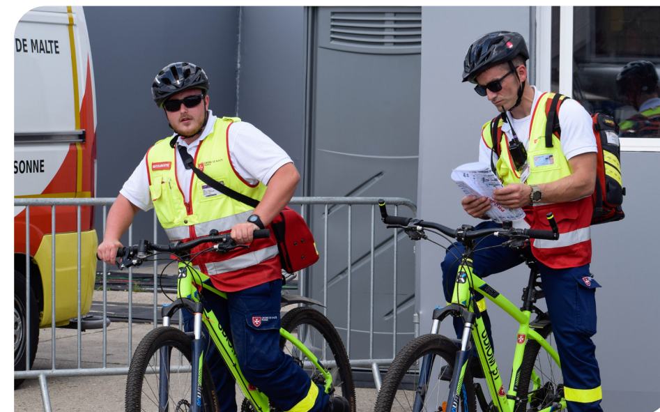
Deux secouristes mobilisés lors du Salon du Bourget en 2023.