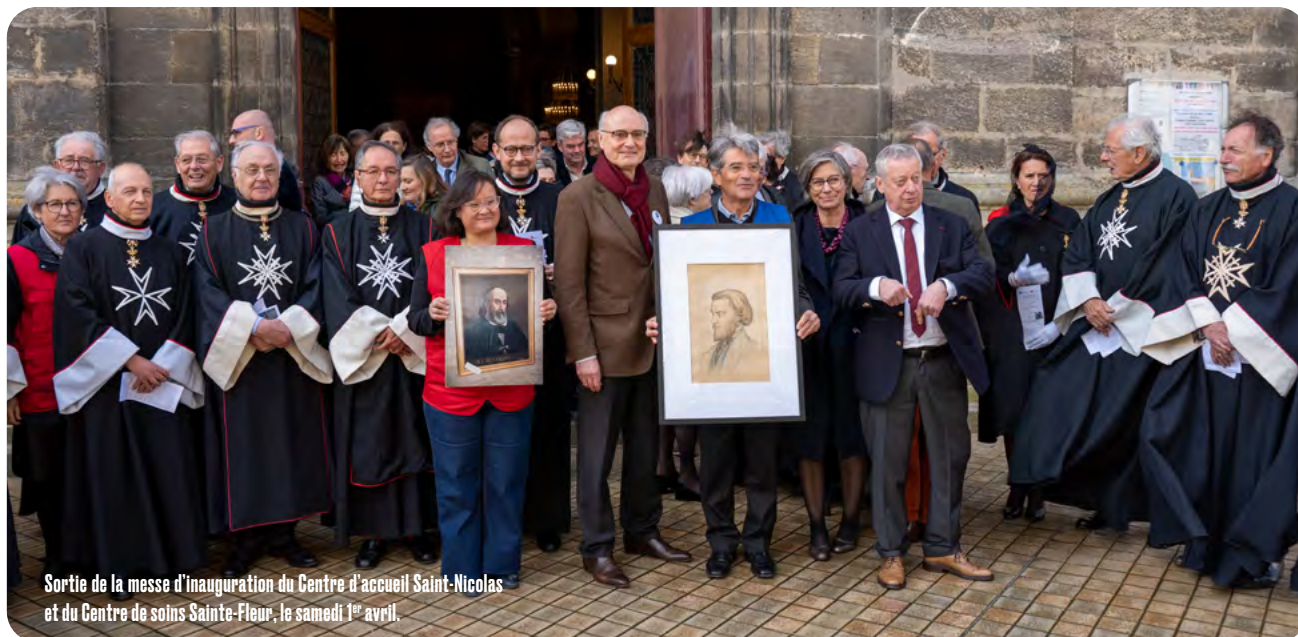
Sortie de la messe d'inauguration du Centre d'accueil Saint-Nicolas et du Centre de soins Sainte-Fleur, le samedi 1 er avril.

Les médecins de l'Ordre de Malte France assurent les consultations à raison d'une demi-journée par mois et par médecin, dans un premier temps. Une dizaine d'infirmières fonctionnent en binôme avec les médecins. Enfin, pour compléter l'équipe, deux bénévoles assurent l'accueil et le secrétariat.