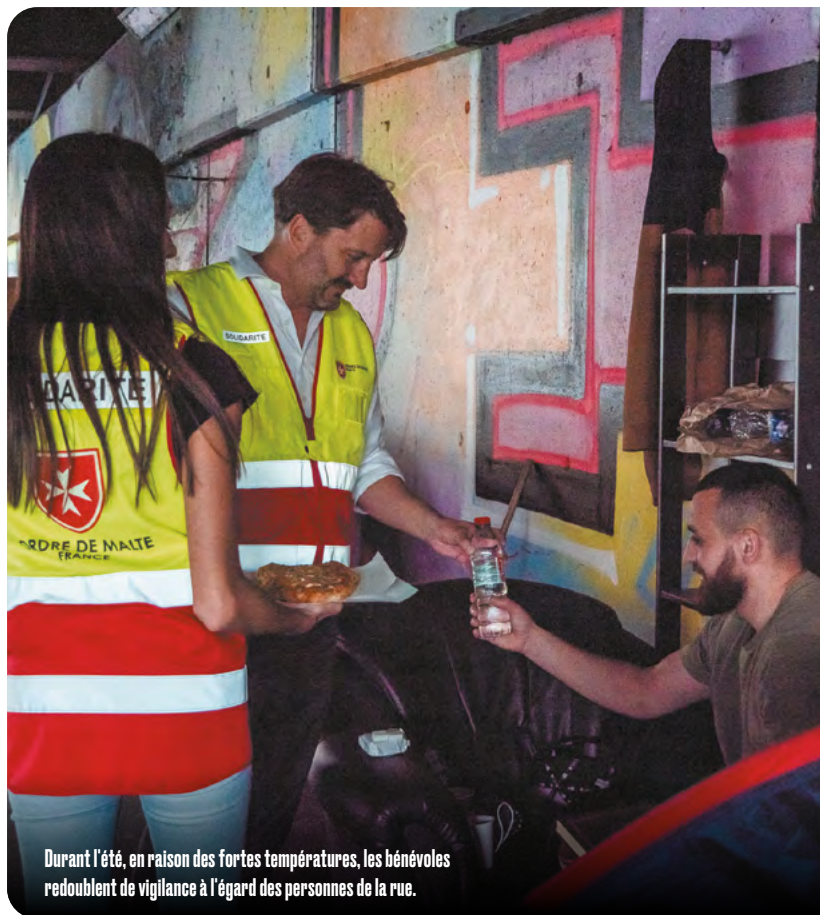
Durant l'été, en raison des fortes températures, les bénévoles redoublent de vigilance à l'égard des personnes de la rue.

« J'aimerais que ce plan existe », concluait-il à l'époque. À l'Ordre de Malte France, les bénévoles y travaillent. Ils mettent tout en œuvre pour continuer à aider les plus démunis. Les maraudes sociales (Rueil-Malmaison (92), Toulon (83)...) se poursuivent sur l'ensemble du territoire. À Paris, les deux centres d'hébergement, le Fleuron Saint-Michel et le Fleuron Saint-Jean, restent ouverts. Les maraudes et permanences médicales (Lille (59), Hauts-de-Seine (92)...) continuent. La distribution de colis alimentaires à Boulogne-Billancourt (92) et au Mans (72) se poursuit aussi. Les bénévoles s'organisent pour être prêts en cas de déclenchement du niveau orange du plan canicule, lorsque les températures ne baissent pas la nuit pendant au moins trois jours consécutifs. C'est le cas en Charente-Maritime où, depuis l'été 2022, le Samusocial sollicite