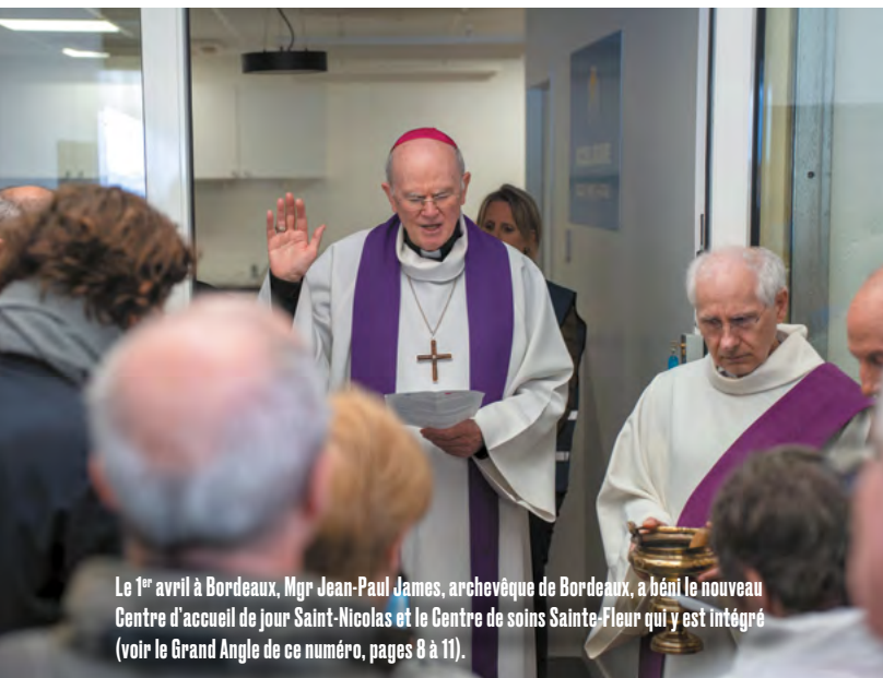
Le 1 er avril à Bordeaux, Mgr Jean-Paul James, archevêque de Bordeaux, a béni le nouveau Centre d'accueil de jour Saint-Nicolas et le Centre de soins Sainte-Fleur qui y est intégré (voir le Grand Angle de ce numéro, pages 8 à 11).