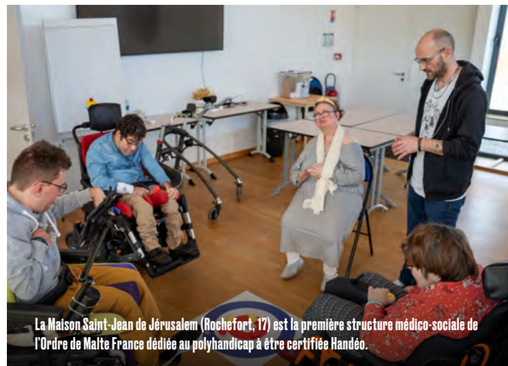
La Maison Saint-Jean de Jérusalem (Rochefort, 17) est la première structure médico-sociale de l'Ordre de Malte France dédiée au polyhandicap à être certifiée Handéo.

Ces derniers sont également allés observer la vie au quotidien au sein des unités et ont étudié de près de nombreux documents internes, afin de vérifier la