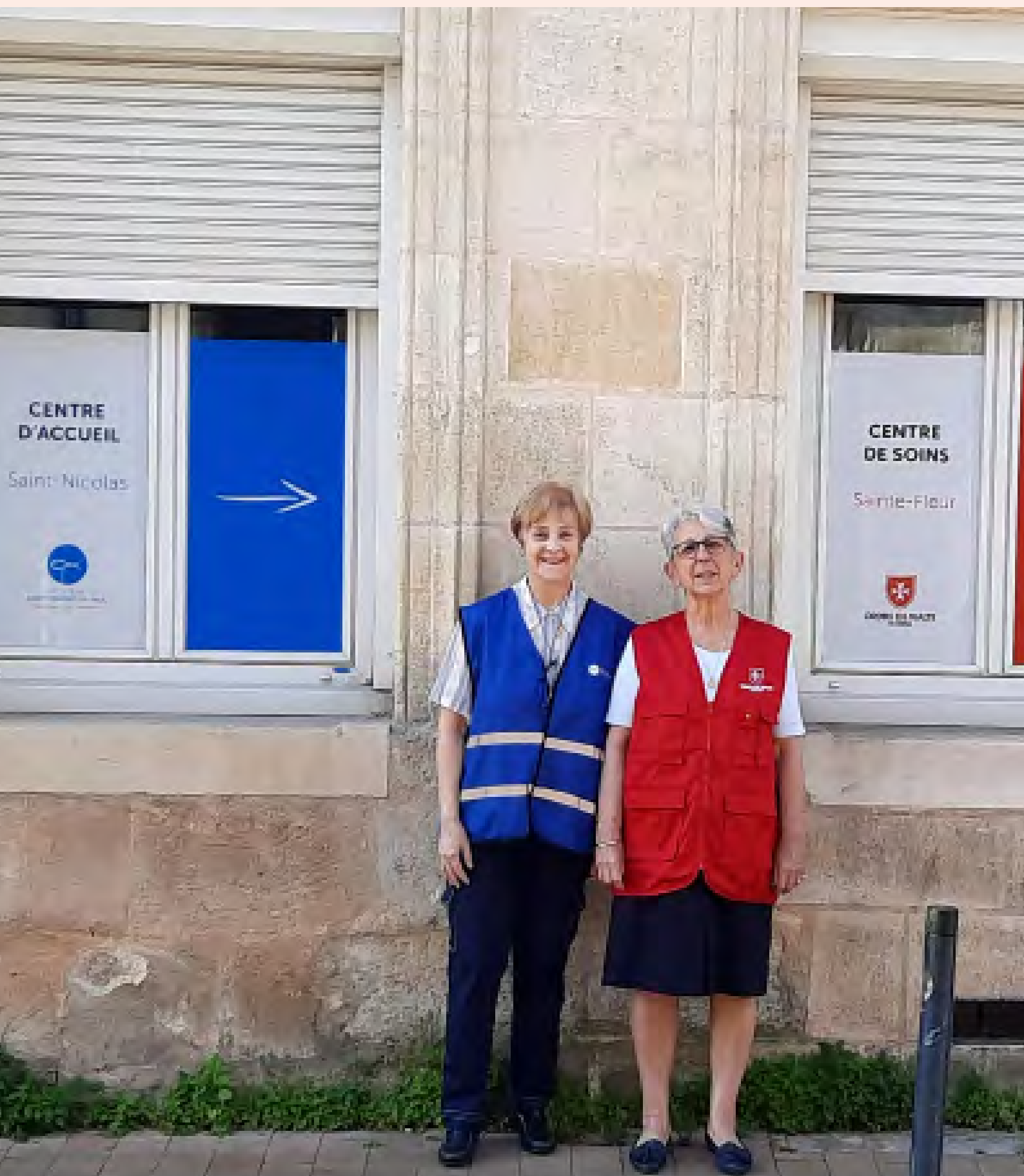
La concrétisation de ce centre « deux en un » est une belle illustration du partenariat entre l'Ordre de Malte France et la Société de Saint-Vincent de Paul, toutes deux associations catholiques reconnues d'utilité publique.