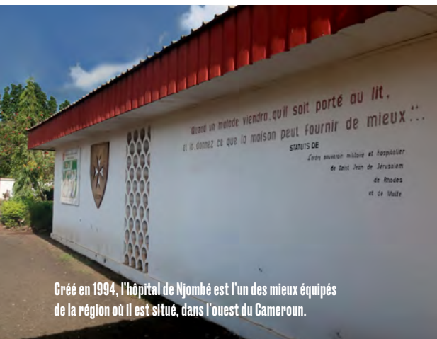
Créé en 1994, l'hôpital de Njombé est l'un des mieux équipés de la région où il est situé, dans l'ouest du Cameroun.

Partout où il est implanté dans le monde, l'Ordre de Malte France accueille de manière très ouverte toutes les personnes qu'il soigne. Au sein de ses hôpitaux, maternités, centres de santé... l'association prend en compte toutes les dimensions de la personne. En parallèle des soins médicaux, l'Ordre de Malte France offre aussi un accompagnement spirituel, en travaillant main dans la main avec différentes congrégations religieuses.