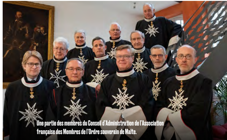
Une partie des membres du Conseil d'Administration de l'Association française des Membres de l'Ordre souverain de Malte.

Créée le 24 juin 1891, puis déclarée au Journal officiel le 21 mars 1921, l'Association française des membres de l'Ordre est une association soumise à la loi du 1 er juillet 1901. Elle est ainsi reconnue d'utilité publique. Sa mission consiste, essentiellement, à rendre concrètes les directives de l'Ordre, basé à Rome, sur le sol français.