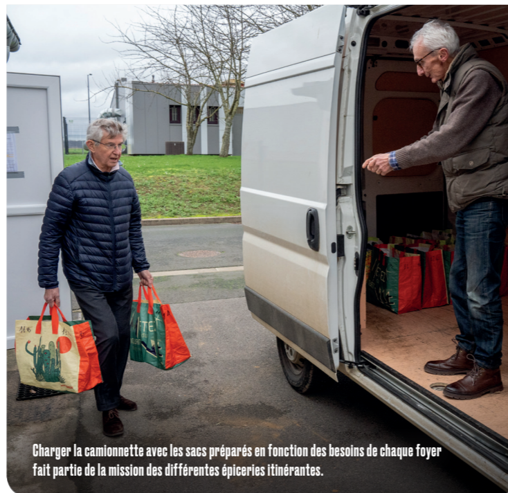
Charger la camionnette avec les sacs préparés en fonction des besoins de chaque foyer fait partie de la mission des différentes épiceries itinérantes.

Mais comment, au-delà de l'aide alimentaire, aider ces personnes, souvent isolées, à retisser des liens sociaux ? « Nous sommes à l'écoute des besoins spécifiques de chacun (emploi et formation, fracture numérique, problématiques énergétiques, etc.). Notre rôle sur ces sujets est celui d'un intermédiaire vigilant faisant re-