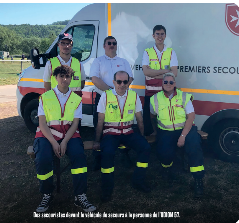
Des secouristes devant le véhicule de secours à la personne de l'UDIOM 57.