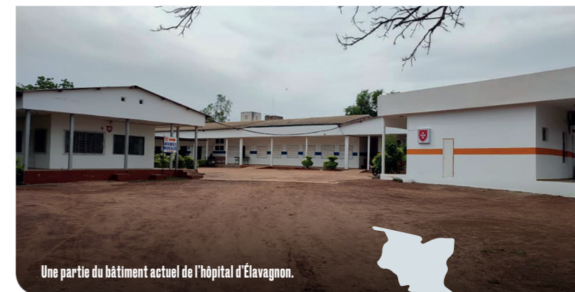
Une partie du bâtiment actuel de l'hôpital d'Élavagnon.

Située à 235 kilomètres au nord-est de Lomé (capitale du Togo), Élavagnon se trouve au cœur d'une zone rurale reculée. Là-bas, 3 % des nouveau-nés décèdent avant un mois. En cause : les infections néonatales et les complications liées à la prématurité. L'existence de l'hôpital d'Élavagnon est donc cruciale pour la population des environs. La fréquentation y est ainsi en hausse constante : entre 2021 et 2022, pour ne parler que du service de pédiatrie, le nombre d'hospitalisations a augmenté de 40 %, et les admissions en néonatalogie de 50 %. Selon Hubert Jeu, directeur