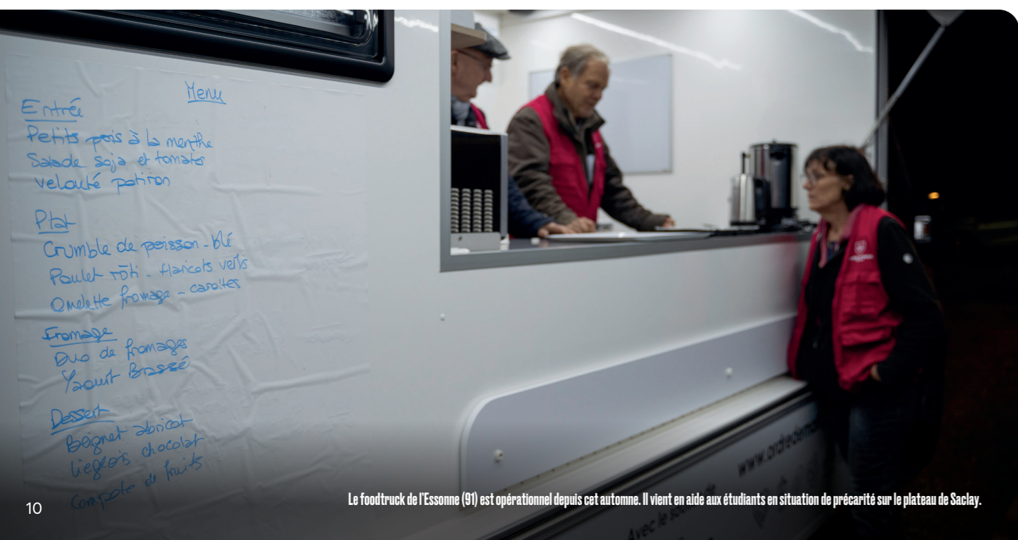
Le foodtruck de l'Essonne (91) est opérationnel depuis cet automne. Il vient en aide aux étudiants en situation de précarité sur le plateau de Saclay.