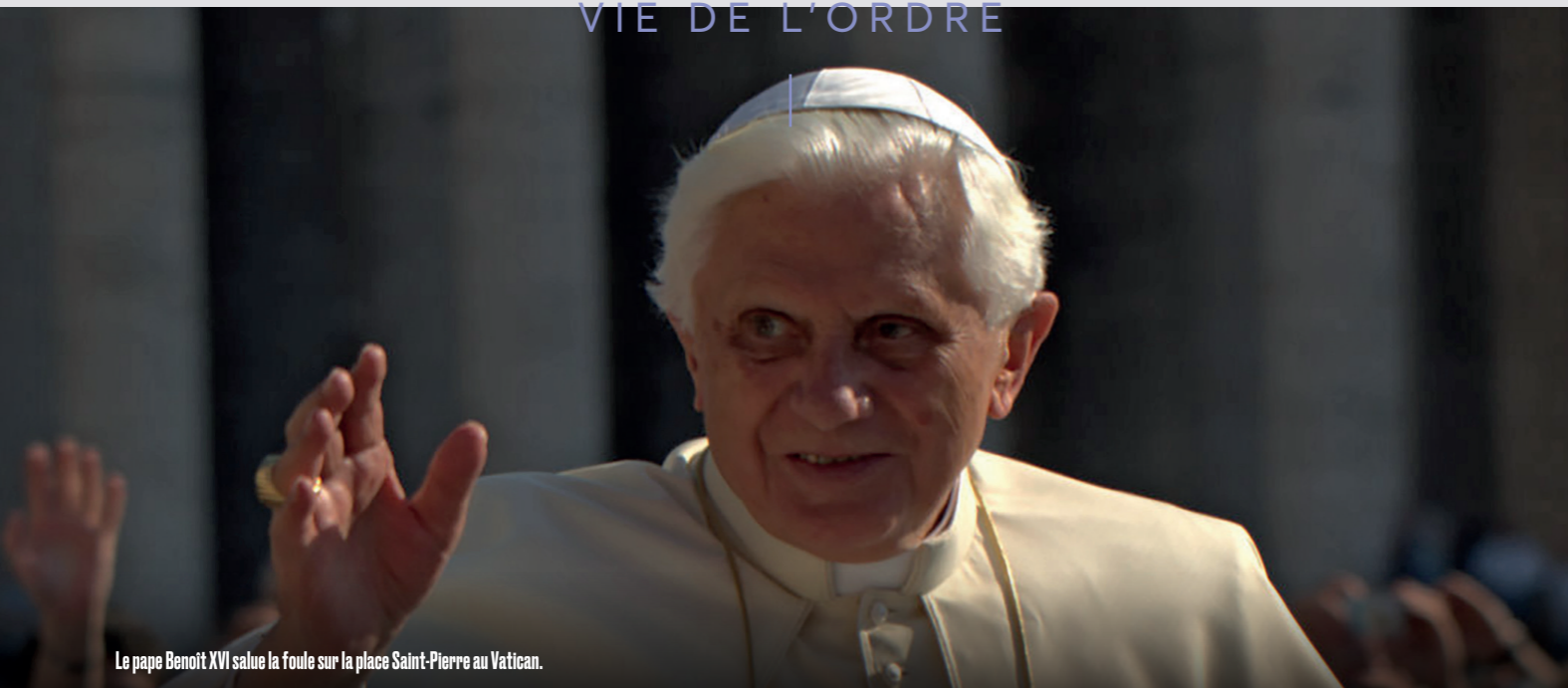
Le pape Benoît XVI salue la foule sur la place Saint-Pierre au Vatican.