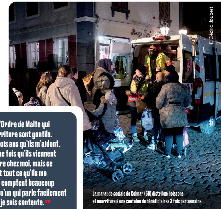
La maraude sociale de Colmar (68) distribue boissons et nourriture à une centaine de bénéficiaires 3 fois par semaine.

Et parce qu'il est essentiel de donner à toutes les personnes aidées le sentiment de dignité, les bénévoles reçoivent, la plupart du temps, un ou quelques euros symboliques en échange des denrées qu'ils apportent chez les uns et les autres.