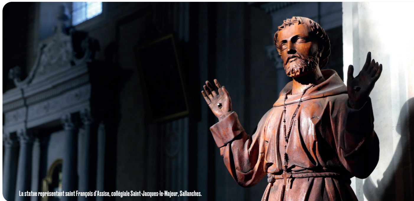
La statue représentant saint François d'Assise, collégiale Saint-Jacques-le-Majeur, Sallanches.