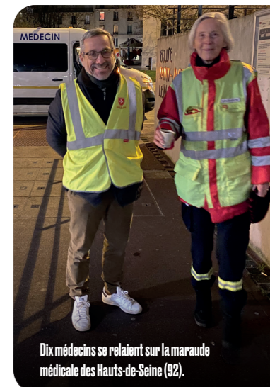
Dix médecins se relayent sur la maraude médicale des Hauts-de-Seine (92).