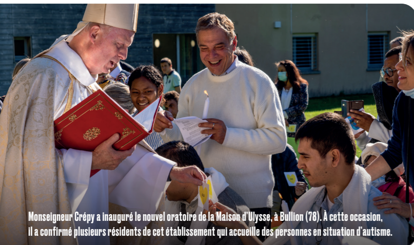
Monseigneur Crépy a inauguré le nouvel oratoire de la Maison d'Ulysse, à Bullion (78). À cette occasion, il a confirmé plusieurs résidents de cet établissement qui accueille des personnes en situation d'autisme.