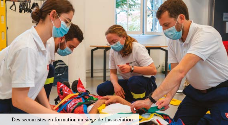
Des secouristes en formation au siège de l'association.

« Former le plus de personnes possible aux gestes de premiers secours est très important. Le citoyen qui sait réagir en quelques secondes devant un accident, une hémorragie... est le premier maillon de la chaîne des secours, qui ne doit jamais s'interrompre. Sans lui, les risques augmentent et ce sont des vies sauvées en moins. »