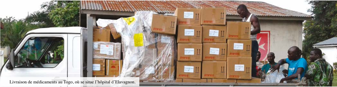
Livraison de médicaments au Togo, où se situe l'hôpital d'Elavagnon.

Notre agrément national de sécurité civile est renouvelé tous les trois ans par le ministère de l'Intérieur. Il est la marque des compétences techniques et humaines de notre association et de sa capacité à traduire les besoins opérationnels sur le terrain avec efficacité, l'inscrivant ainsi dans la chaîne nationale des secours d'urgence. Dans ce cadre, et parce que nous veillons à assurer toujours mieux nos missions, nos besoins techniques et matériels (véhicules, défibrillateurs, brancards...) sont de plus en plus importants et nécessitent des investissements financiers réguliers, car notre action s'inscrit dans la durée. ■