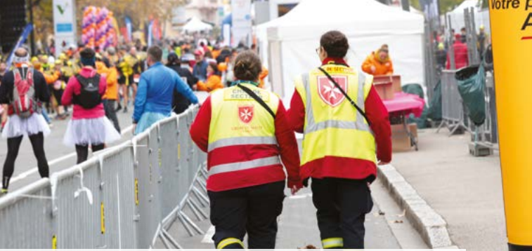
Les secouristes de plusieurs Udiom étaient présents sur le dispositif prévisionnel de secours du marathon du Beaujolais, fin novembre 2021.