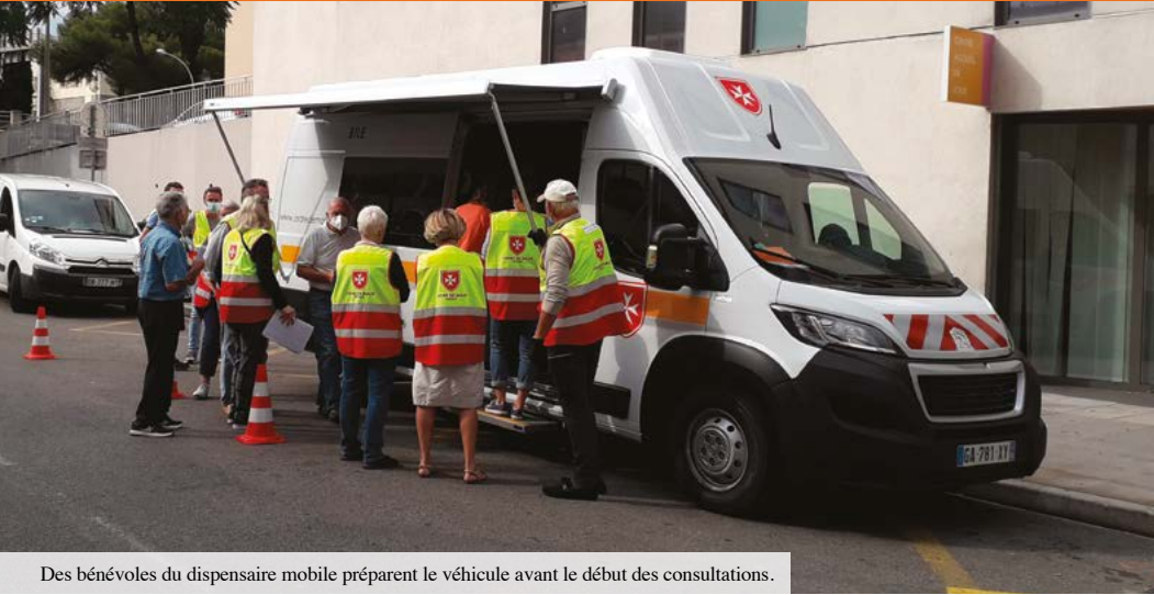
Des bénévoles du dispensaire mobile préparent le véhicule avant le début des consultations.

La délégation des Alpes-Maritimes, basée à Nice (06), a mis en service un dispensaire mobile fin septembre. Objectif : proposer une offre de soins de qualité à des populations isolées. Une réponse indispensable à de nombreux besoins.