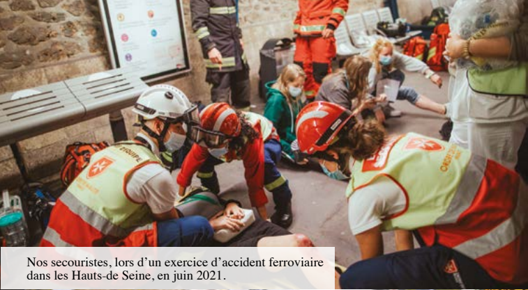
Nos secouristes, lors d'un exercice d'accident ferroviaire dans les Hauts-de-Seine, en juin 2021.

Les Udiom ont également vocation à intervenir en soutien des secours publics dans le cadre des plans d'urgence (Orsec). Elles sont alors déclenchées par les pouvoirs publics et agissent en relation avec les mairies, préfectures et zones de défense et de sécurité.