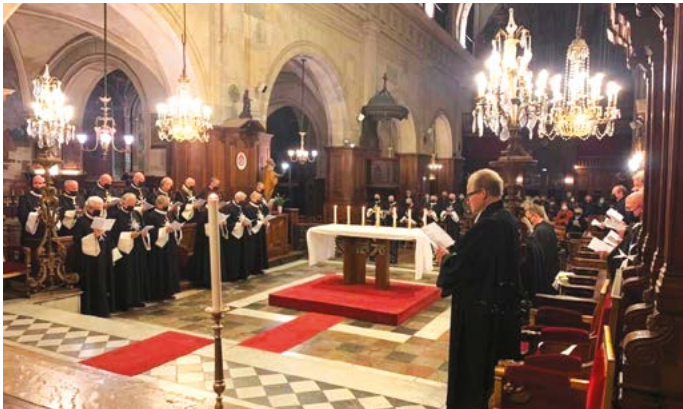
Cérémonie œcuménique à Sainte-Elisabeth de Hongrie à Paris, le 20 janvier 2022.

L'Association française des membres de l'Ordre Souverain de Malte et la Commanderie française de l'Ordre de Saint-Jean, du Grand Baillage de Brandebourg, ont établi des liens confraternels depuis de longues années. Leurs membres respectifs participent