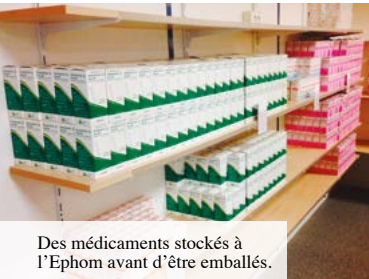
Des médicaments stockés à l'Ephom avant d'être emballés.