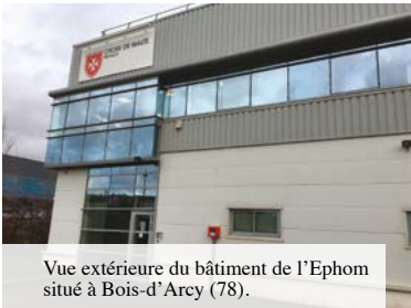
Vue extérieure du bâtiment de l'Ephom situé à Bois-d'Arcy (78).

Les deux salariés de l'Ephom ont géré plus de 120 expéditions à destination de 18 pays, pour un total de près de 83 tonnes (contre près de 49 tonnes l'année précédente) de médicaments et de matériel, pour une valeur de près de 2 millions d'euros.