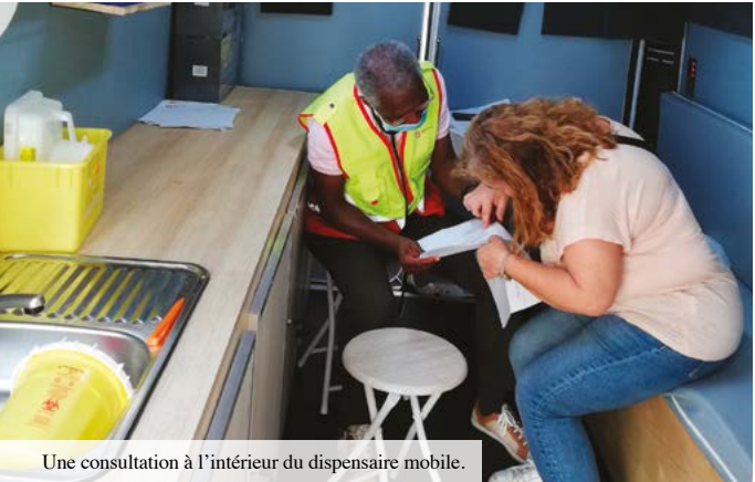
Une consultation à l'intérieur du dispensaire mobile.

Forte de ce succès, la délégation étudie actuellement la possibilité d'étendre cette offre de soins mobile aux plus démunis à Antibes et à Menton, en lien avec les CCAS de ces deux villes.