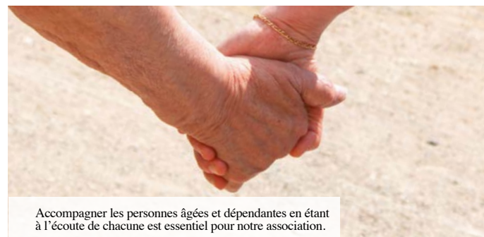
Accompagner les personnes âgées et dépendantes en étant à l'écoute de chacune est essentiel pour notre association.

Petit retour en arrière. En 2019, l'ARS lance un appel à manifestation d'intérêt (AMI), sur le thème « Des solutions innovantes pour faire face aux défis du grand âge ». La crise sanitaire va bloquer pendant un moment l'étude des 375 réponses. Reprise fin 2021. La Maison Ferrari est le seul établissement des Hauts-de-Seine à être sélectionné et signe une convention avec l'ARS portant sur le financement et l'accompagnement de la mise en œuvre de son projet.