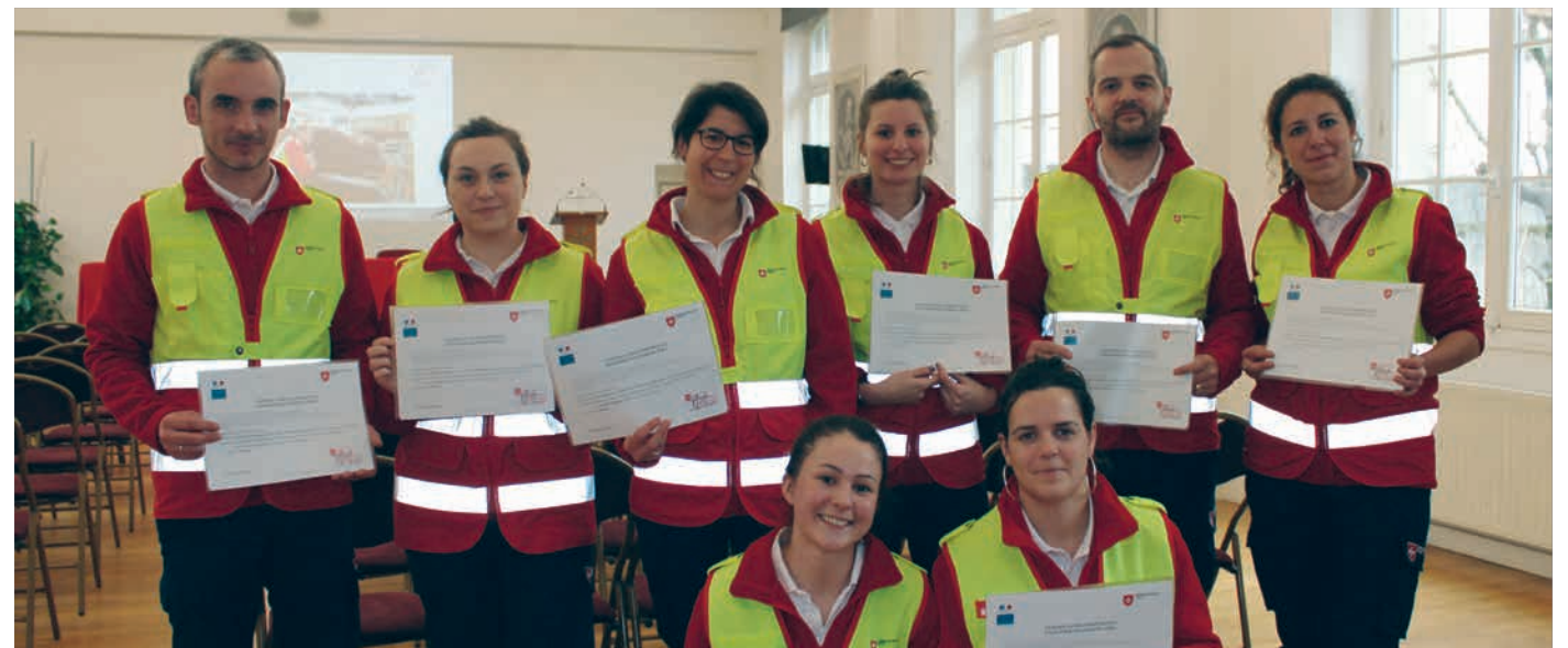
La nouvelle équipe de salariés secouristes du siège de l'Ordre de Malte France, en janvier 2020.