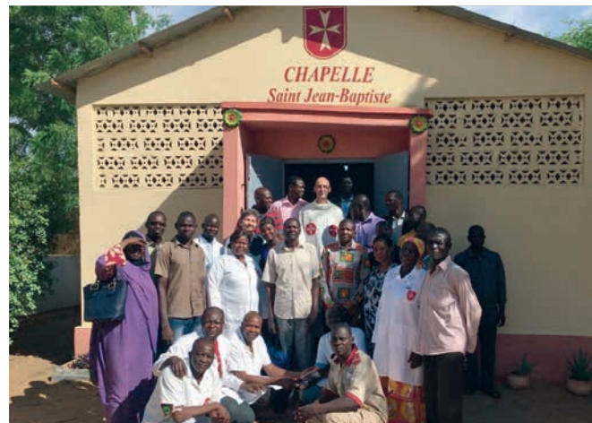
La délégation du Cher a financé la construction de la chapelle Saint Jean-Baptiste à Am'Toukoui et celle d'une grotte mariale à Wallia.