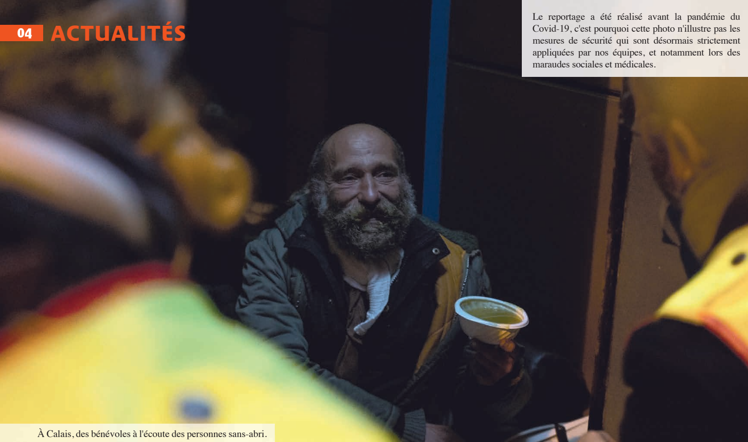
À Calais, des bénévoles à l'écoute des personnes sans-abri.

Le reportage a été réalisé avant la pandémie du Covid-19, c'est pourquoi cette photo n'illustre pas les mesures de sécurité qui sont désormais strictement appliquées par nos équipes, et notamment lors des maraudes sociales et médicales.