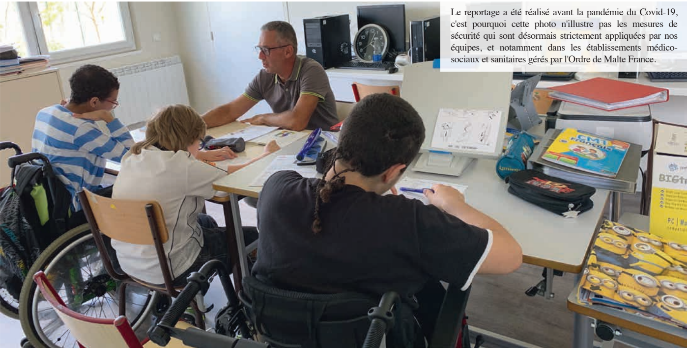
Le reportage a été réalisé avant la pandémie du Covid-19, c'est pourquoi cette photo n'illustre pas les mesures de sécurité qui sont désormais strictement appliquées par nos équipes, et notamment dans les établissements médico-sociaux et sanitaires gérés par l'Ordre de Malte France.

Le Rapport d'Activité et l'Essentiel sont téléchargeables sur le site Internet www.ordredemaltefrance.org . Vous pouvez également vous faire envoyer ces documents en appelant le service relations donateurs.