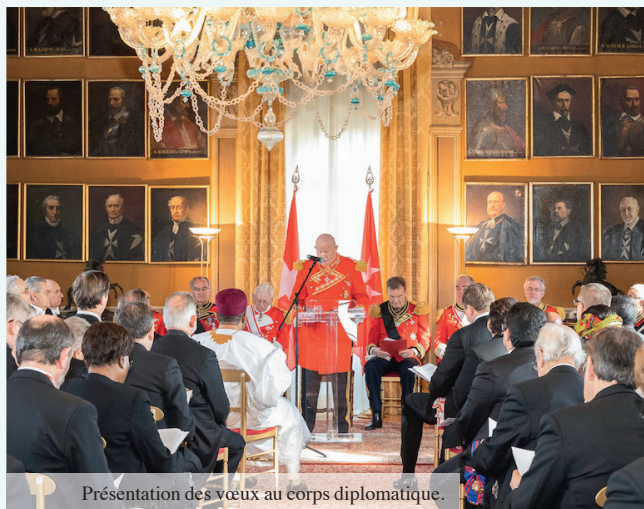
Présentation des vœux au corps diplomatique.

Chers consœurs, chers confrères, chers bienfaiteurs de l'Ordre de Malte dans le monde,