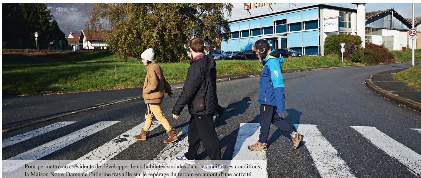
Pour permettre aux résidents de développer leurs habiletés sociales dans les meilleures conditions, la Maison Notre-Dame de Philermes travaille sur le repérage du terrain en amont d'une activité.