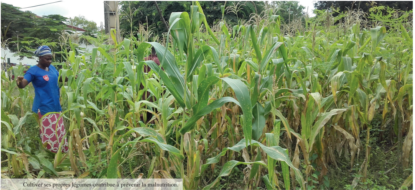
Cultiver ses propres légumes contribue à prévenir la malnutrition.