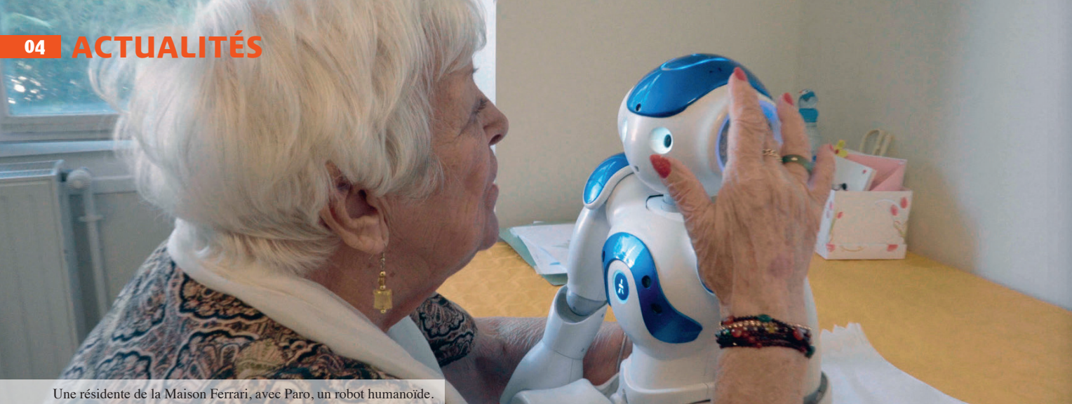
Une résidente de la Maison Ferrari, avec Paro, un robot humanoïde.