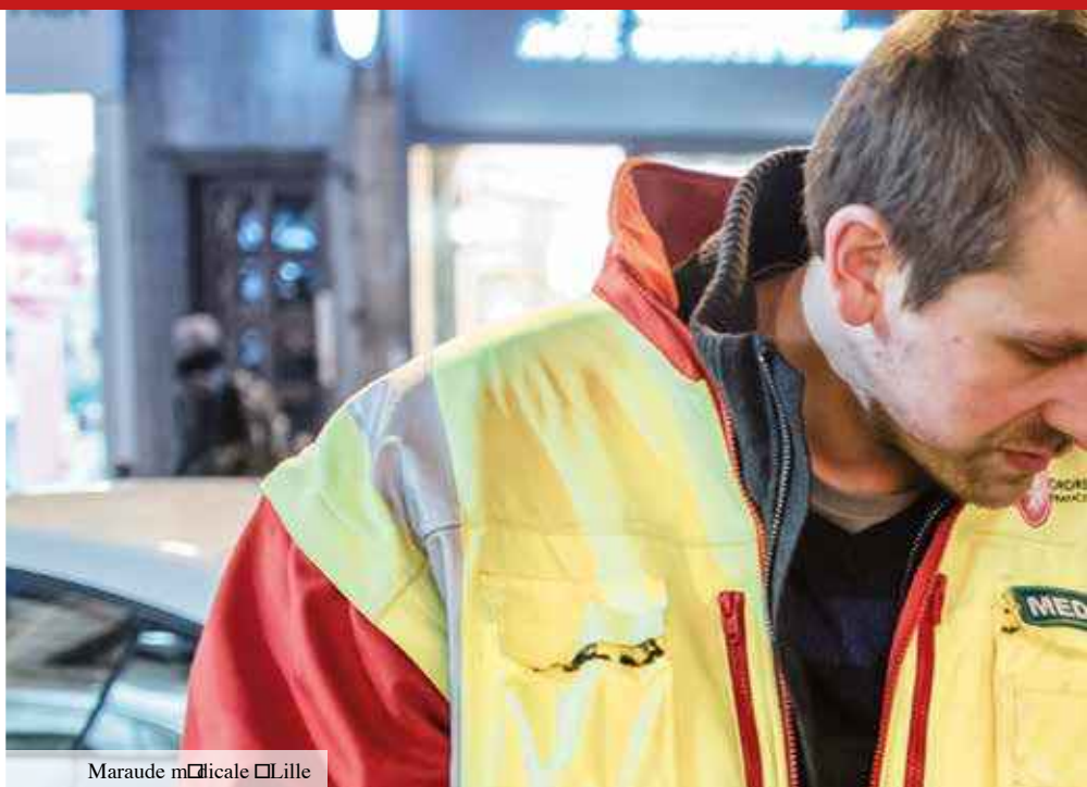
Maraude médicale à Lille