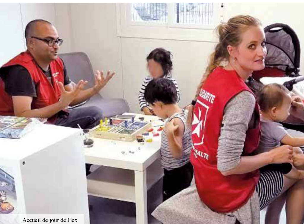
Accueil de jour de Gex