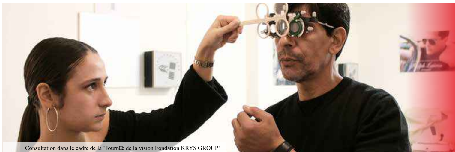
Consultation dans le cadre de la "Journée de la vision Fondation KRYSS GROUP"

Grâce à ce partenariat, la Fondation KRYSS GROUP et l'Ordre de Malte France mobilisent donc leurs énergies et leurs compétences très complémentaires pour agir collectivement. Cette collaboration multi-acteurs démontre que les entreprises peuvent venir enrichir les solutions proposées par les associations aux enjeux sociaux. ■