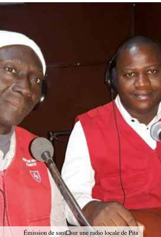
Émission de santé sur une radio locale de Pita