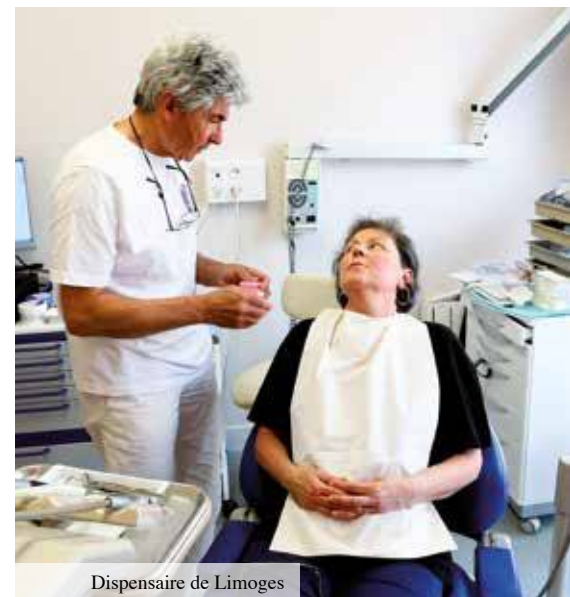
Dispensaire de Limoges

Les phénomènes d'exclusion se sont considérablement développés au cours des dernières décennies, contribuant à accentuer le rôle social des acteurs de l'offre de soins auprès des populations précaires. Ainsi, une étude 3 de l'Observatoire national de la pauvreté et de l'exclusion sociale recommande d'améliorer « le maillage territorial des services de soins ambulatoires » - c'est-à-dire effectués en cabinets, dispensaires, centres de soins - et de développer « les soins primaires » pour soulager les services d'urgences, engorgés par les patients venant pour des raisons inadaptées. Le « modèle de santé fondé sur une logique de soins » qu'on a pu qualifier de « modèle de soins » doit être refondé sur une logique active de proposition des soins. Des propositions qui prennent tout leur sens pour l'Ordre de Malte France, qui, à l'heure où l'association inaugure son quatrième dispensaire en France. Insérée dans le réseau sanitaire local, elle s'efforce d'intervenir là où des besoins ne sont pas couverts par le système de santé actuel, en proposant des solutions adaptées, toujours en partenariat avec d'autres associations et les organismes publics.