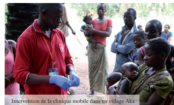
Intervention de la clinique mobile dans un village Aka

Depuis le lancement de ce programme, deux cliniques mobiles ont été mises en circulation. Il s'agit bien sûr d'offrir des soins de qualité, en particulier aux femmes enceintes, afin que la majorité d'entre-elles aient accès sans difficulté à des consultations prénatales. Un autre véhicule est utilisé pour les urgences, notamment le transport vers l'hôpital de Bétou des patients présentant des pathologies trop complexes ou trop graves pour être traitées à Enyellé.