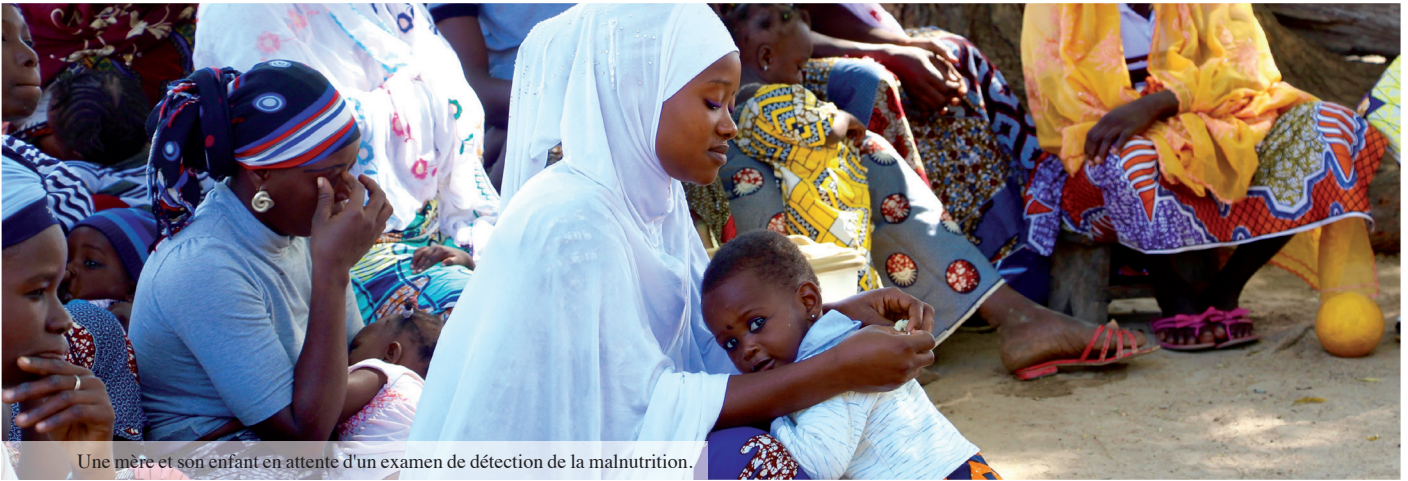
Une mère et son enfant en attente d'un examen de détection de la malnutrition.