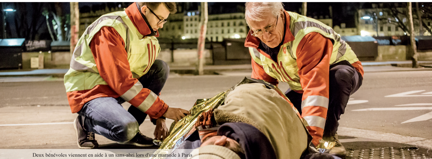
Deux bénévoles viennent en aide à un sans-abri lors d'une maraude à Paris