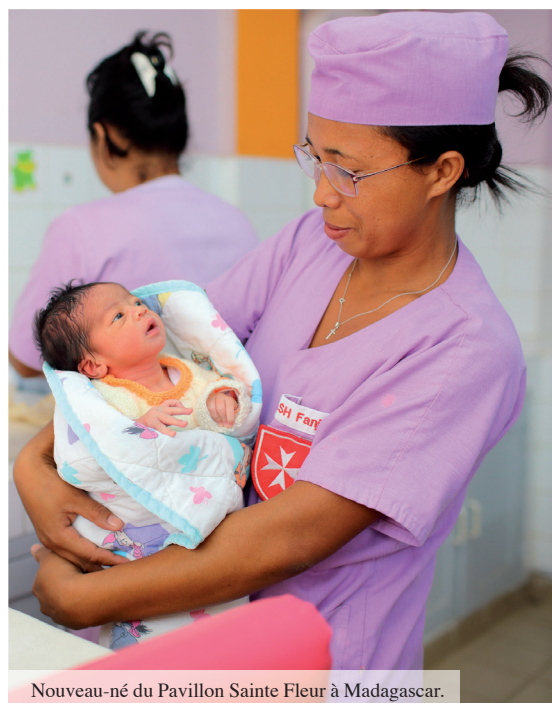
Nouveau-né du Pavillon Sainte Fleur à Madagascar.