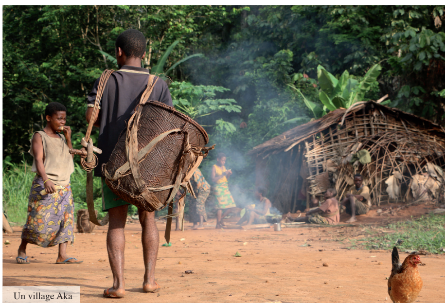
Un village Aka

Pour valoriser l'identité de cette population marginalisée, lui redonner confiance en elle, il est nécessaire de lui faire prendre conscience de ses droits fondamentaux et de lui donner des clés pour les faire respecter. L'organisation de réunions de sensibilisation menées par des personnes de la communauté Aka est à l'étude. L'Association des Spiritains du Congo (ASPC) est déjà mobilisée sur cette question et sensibilise les Aka à leurs droits fondamentaux au travers des écoles ORA (Observer, Réfléchir, Agir), réservées aux « autochtones ».