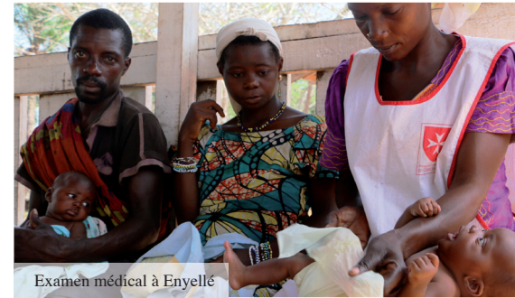
Examen médical à Enyellé

800 000 € par l'Ordre de Malte France, l'Agence Française du Développement (AFD) et le Global Fund for Forgotten People (GFFP).