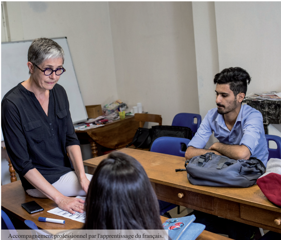
Accompagnement professionnel par l'apprentissage du français.

En Indre-et-Loire, 273 adultes ont été accompagnés, dont 197 en capacité d'accéder à un emploi.