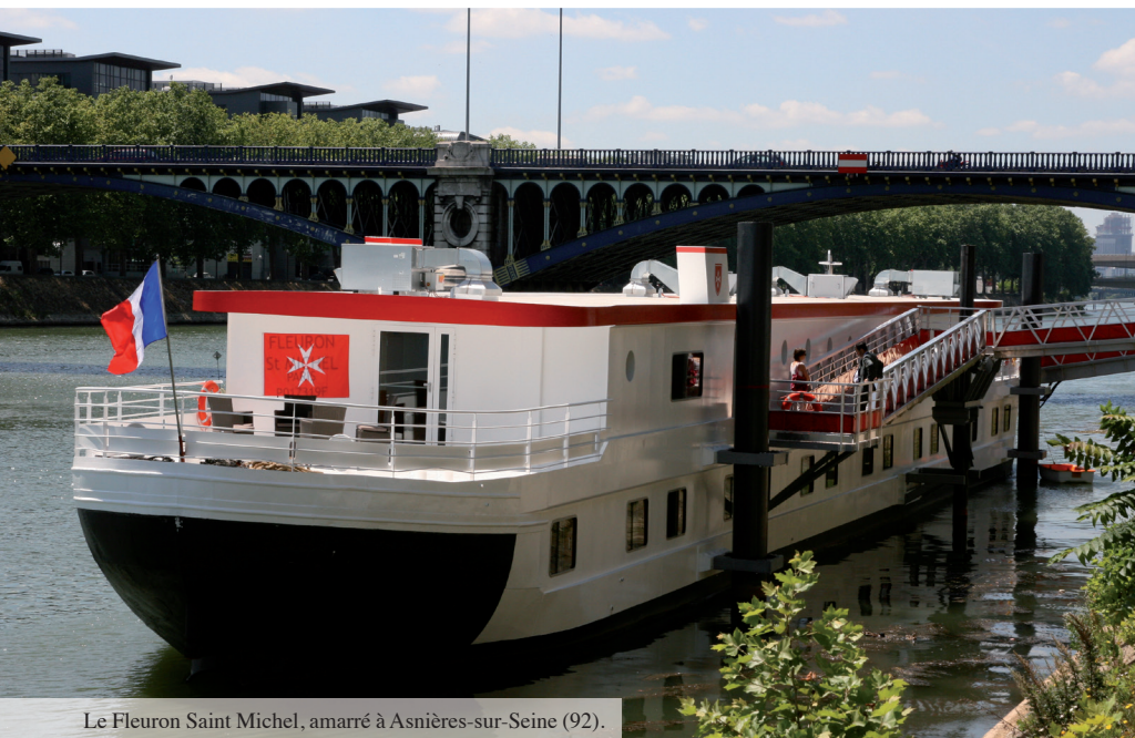
Le Fleuron Saint Michel, amarré à Asnières-sur-Seine (92).