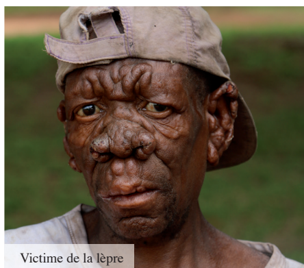
Victime de la lèpre