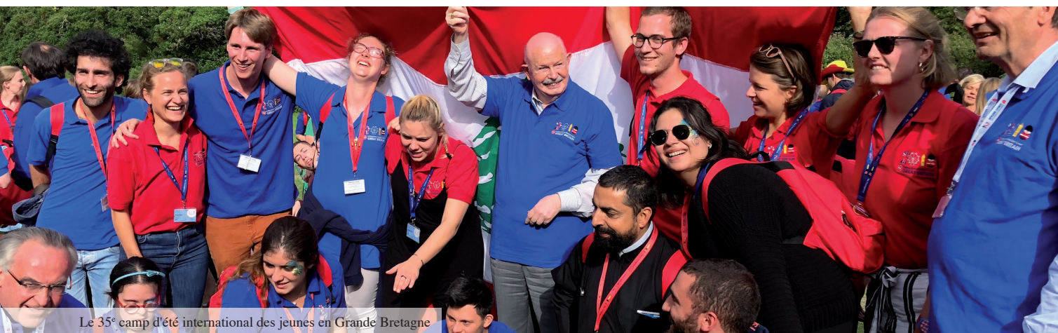
Le 35 e camp d'été international des jeunes en Grande Bretagne