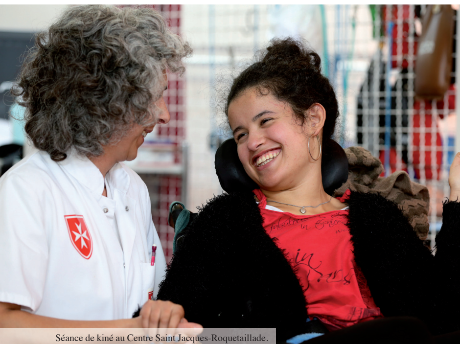
Séance de kiné au Centre Saint Jacques-Roquetaillade.