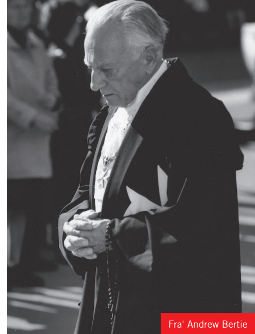
Fra' Andrew Bertie