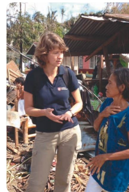
Philippines : aide aux populations après le typhon Haiyan en novembre 2013.