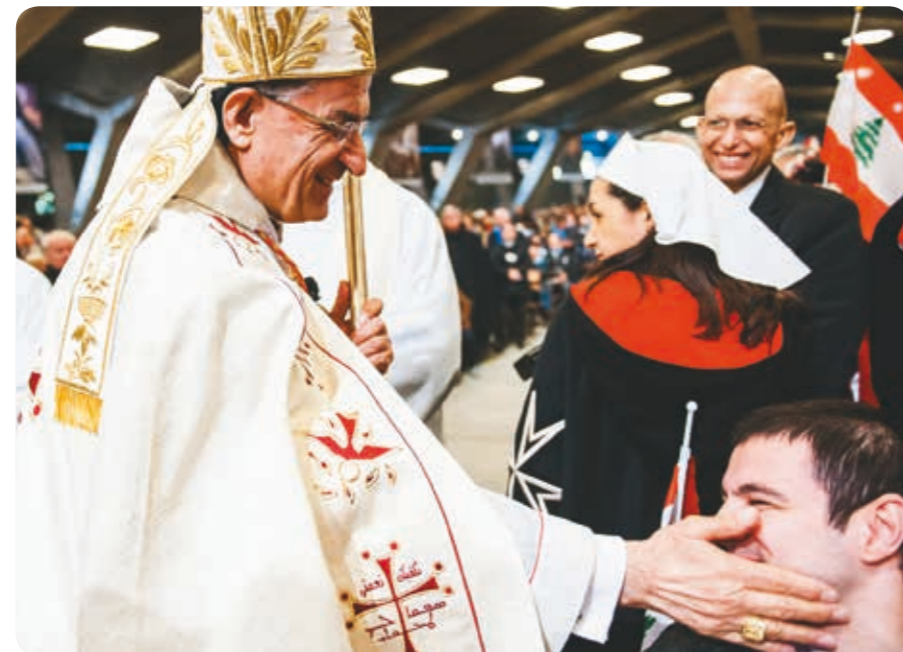
Cardinal Bechara Boutros Rai, 77 ème patriarche maronite d'Antioche et de tout l'Orient.

Nul doute que l'intensité des moments vécus, alliant naturellement les charismes fondamentaux de l'Ordre — Obsequium pauperum (l'attention donnée aux pauvres, aux malades...) et Tuitio fidei (la protection, la défense de la foi) — ait été pour les pèlerins, les hospitalières et les hospitaliers de l'Ordre, mais surtout pour les malades, une démonstration vécue de ce thème pastoral... L'émotion des effusions du départ n'a fait que confirmer ce sentiment. ■