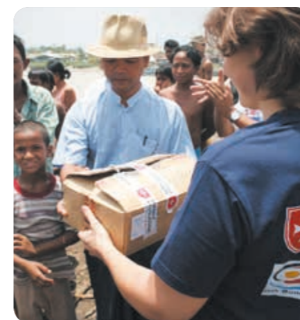
Birmanie 2008 : tandis que les humanitaires attendent à la frontière, les équipes de l'Ordre de Malte sont sur le terrain grâce à la présence de Malteser International dans le pays depuis 2001.

L'institution a ouvert son siège régional « Amériques » en novembre 2013 et prépare celui de la région « Asie Pacifique ».