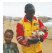
Photo de couverture : Intervention de nos ambulanciers au Burkina Faso pour porter secours aux réfugiés maliens - avril 2013.

Le 56 ème pèlerinage international à Lourdes sous le signe des chrétiens d'Orient