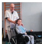
Photo de couverture : L'ergothérapeute du CPMPR de Roquetaillade ajuste le fauteuil d'un des résidents.

La paix : fruit de la justice et de la charité