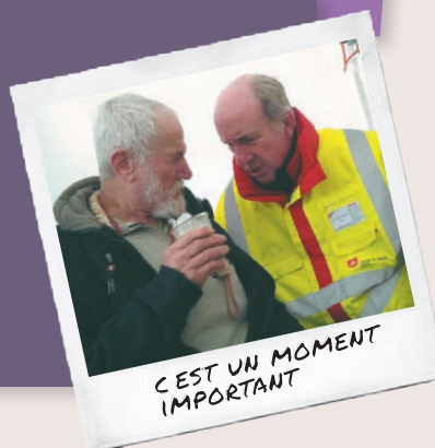
CEST UN MOMENT IMPORTANT