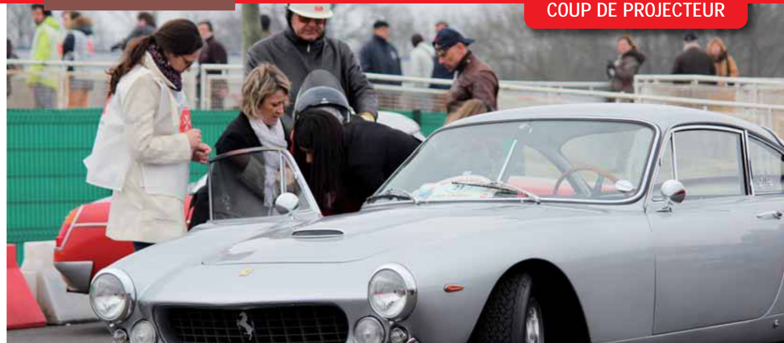
Une journée inoubliable pour les 130 personnes handicapées présentes pour cette 7 e édition.

Mais quelle serait la force d'action de nos bénévoles et salariés sans votre soutien ? C'est pourquoi, au nom de toutes nos équipes, je tiens à vous exprimer mes plus sincères remerciements pour votre générosité et votre confiance.