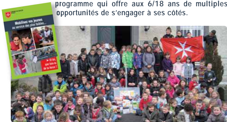
La générosité des élèves de l'école Notre-Dame à Saint-Flour (15) a permis d'alimenter les petits déjeuners servis à la cathédrale.

Devant le succès croissant de P'tits déj' en Carême , l'Ordre de Malte France lance « Et toi, que fais-tu de ta force ? », un programme qui offre aux 6/18 ans de multiples opportunités de s'engager à ses côtés.