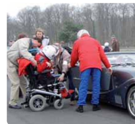
Des bénévoles aident une personne handicapée à monter dans une voiture de collection.

P près de 130 personnes handicapées venues d'établissements spécialisés d'Ile-de-France et une soixantaine de jeunes bénévoles de l'Ordre de Malte France sont arrivés au matin sur le mythique anneau de Linas-Montlhéry, ouvert pour l'occasion par l'UTAC 2 . Peu à peu, les 110 pilotes, également bénévoles, les ont rejoints à bord de véhicules d'exception. Puis le personnel de l'UTAC s'est mis en place, prêt à donner de son temps pour la sécurité et la fluidité des tours de piste. Tour à tour, les équipages se sont élancés à bord d'une sublime Bugatti, d'une Ferrari rouge d'hyper puissance, d'une fabuleuse Howmet TX propulsée par un moteur à turbines, et bien d'autres encore... « C'était génial... », « Je n'ai pas eu peur... » : tremblant encore d'émotion,