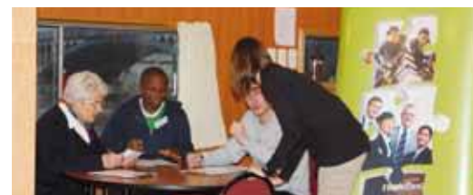
Exercices individuels et collectifs, jeux de rôles, mises en situation : un atelier de coaching réussi !

Samedi 11 décembre 2010, le premier atelier de coaching a réuni six passagers et quatre bénévoles. Exercices individuels et collectifs, jeux de rôles : chacun s'est exercé aux pratiques professionnelles les plus en pointe. Cet enthousiasme s'est depuis propagé : plusieurs autres