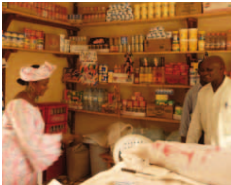
À Conakry, en Guinée, une nouvelle épicerie vient de voir le jour !

Tous sont plein d'espoir car avec la réussite qu'ils espèrent, c'est la tête haute qu'ils réintégreront leur communauté. Le verdict tombe : 10 projets sont acceptés, le 11 e est seulement ajourné, pour complément d'informations. Ainsi, dans quelques mois, ces micro-entreprises ouvriront à Conakry, notamment : un taxi et un service de transport interurbain, quatre échoppes, une entreprise de pêche et de fumage de poissons ou encore