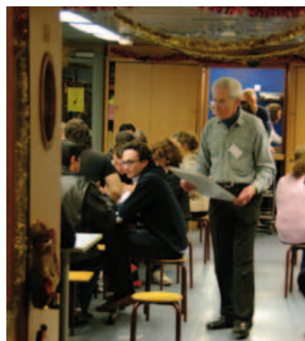
Nos bénévoles se mobilisent à bord du Fleuron Saint-Jean pour passer du temps avec les personnes sans-abri.