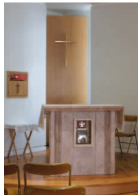
Le chœur et l'autel de la chapelle.

Chapelain Conventuel ad honorem de l'Ordre de Malte