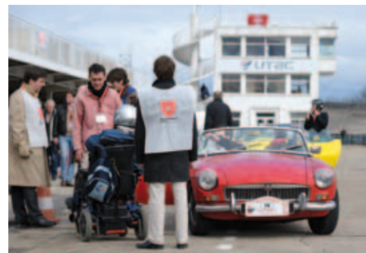
Journée « Sport auto et Handicap » à Montlhéry (Essonne).

Pour les bénévoles de l'Ordre de Malte France, l'engagement personnel est motivé par la joie de faire, le désir de donner de son temps et de ses compétences, d'exercer des responsabilités, de partager son énergie et sa passion.