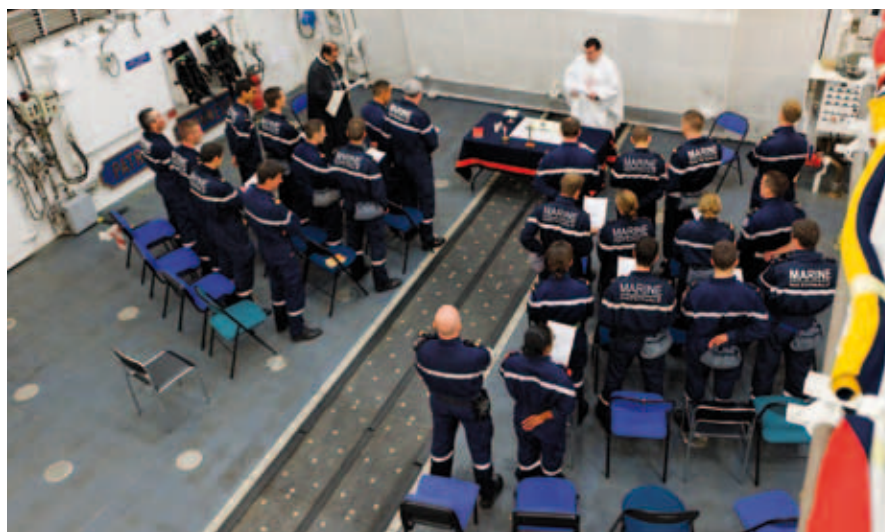
Messe de Pâques célébrée sur la frégate « Chevalier Paul ».