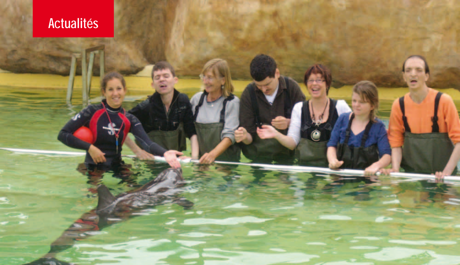
À Antibes, les résidents du centre Saint-Jean-de-Jérusalem (à Rochefort) ont approché Kali, un dauphin femelle.