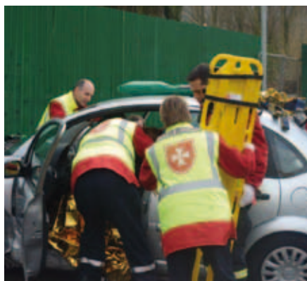
Des secouristes bénévoles de l'Ordre de Malte France en action.

« Sport auto et Handicap 2010 2 » a simplement répondu : « Rouler pour une bonne cause, c'est toujours mieux que de rouler tout seul ! ».