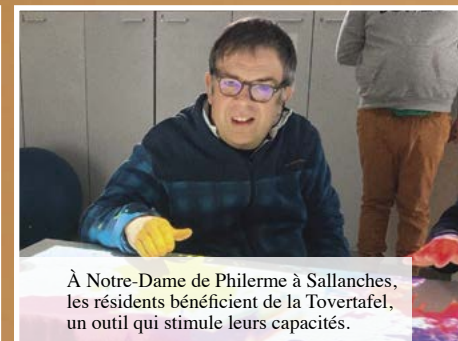
À Notre-Dame de Philorme à Sallanches, les résidents bénéficient de la Tovertafel, un outil qui stimule leurs capacités.