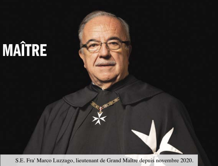
S.E. Fra' Marco Luzzago, lieutenant de Grand Maître depuis novembre 2020.

Ses premiers mots aux membres du Conseil Complet d'État furent : "le Saint-Esprit a tourné avec bienveillance son regard vers moi. (...) Pour ma part, je ne peux que vous assurer de mon engagement maximal pour faire face aux défis qui nous attendent dans les prochains mois. En premier lieu, la réforme de la Charte Constitutionnelle et du Code, menée avec force par notre regretté Fra' Giacomo, vers lequel va en ce moment ma pensée émue".