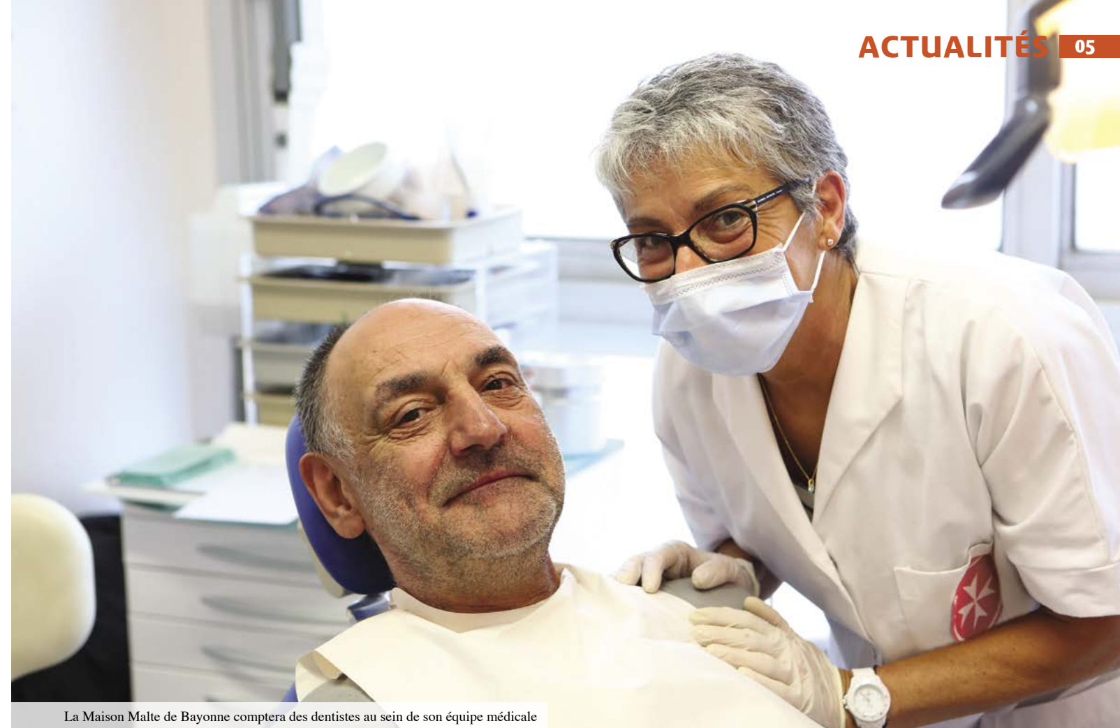
La Maison Malte de Bayonne comptera des dentistes au sein de son équipe médicale

Pour en savoir plus : ordredemaltefrance.org/formez-vous/particuliers/formez-vous-au-psc1