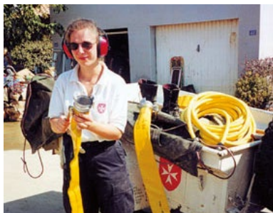
LAT SPS - Spécialiste matériel d'épuisement et d'assèchement