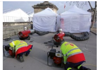
LAT DPS - Aide au montage des infrastructures électriques du DPS du Salon International Aéronautique du Bourget en 2015

Agissant dans le cadre d'une mission de service public, vous pouvez intervenir partout où une présence qualifiée est nécessaire, et participer ainsi à la protection des populations et à la défense de notre société.