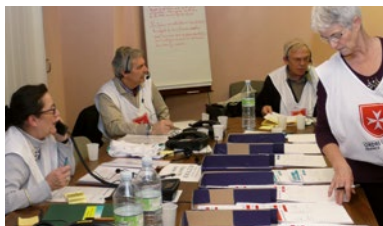
LAT APS - Centre d'Information du Public de la préfecture de police