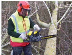
LAT SPS - Soutien aux populations des zones dévastées par la tempête KLAUS en 2009