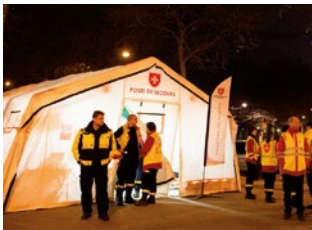
LAT APS - Appui psychologique aux personnes impliquées pendant les attentats de janvier et novembre 2015 à Paris