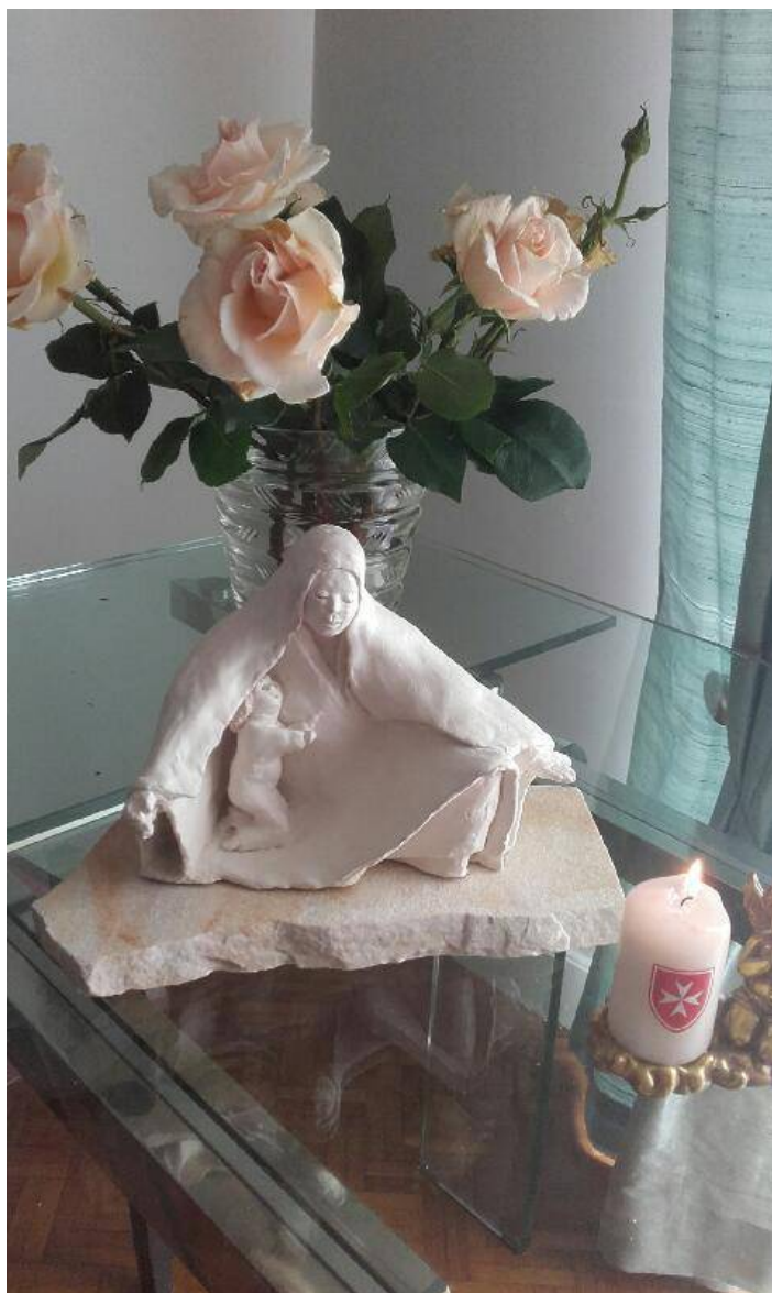
Notre-Dame de la rue