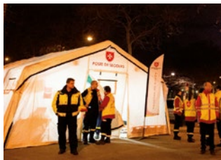
LAT APS - Appui psychologique aux personnes impliquées pendant les attentats de janvier et novembre 2015 à Paris