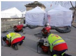
LAT DPS - Aide au montage des infrastructures électriques du DPS du Salon International Aéronautique du Bourget en 2015

Agissant dans le cadre d'une mission de service public, vous pouvez intervenir partout où une présence qualifiée est nécessaire, et participer ainsi à la protection des populations et à la défense de notre société.