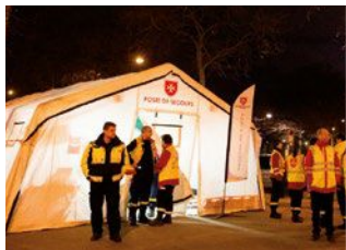
LAT APS - Appui psychologique aux personnes impliquées pendant les attentats de janvier et novembre 2015 à Paris