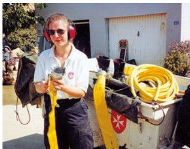
LAT SPS - Spécialiste matériel d'épuisement et d'assèchement