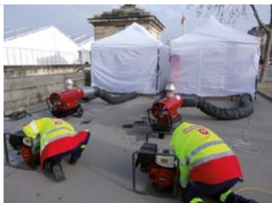
LAT DPS - Aide au montage des infrastructures électriques du DPS du Salon International Aéronautique du Bourget en 2015

Agissant dans le cadre d'une mission de service public, vous pouvez intervenir partout où une présence qualifiée est nécessaire, et participer ainsi à la protection des populations et à la défense de notre société.