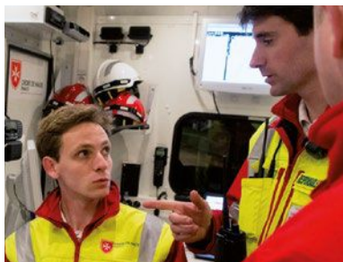
LAT DPS - Spécialiste transmissions