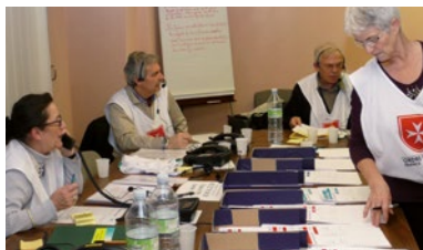
LAT APS - Centre d'Information du Public de la préfecture de police