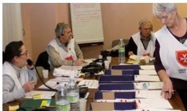
LAT APS - Centre d'Information du Public de la préfecture de police