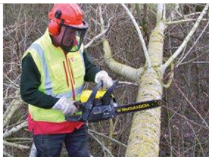
LAT SPS - Soutien aux populations des zones dévastées par la tempête KLAUS en 2009