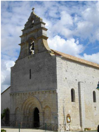
 glise Saint Jean Baptiste

Sous la Pr sidence du Comte de BEAUMONT- BEYNAC Pr sident de l'Ordre de Malte France